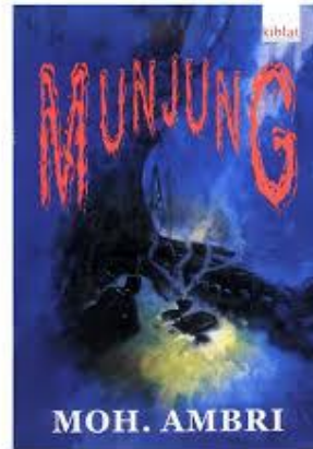
Gambar 3. 1 Jilid Novel Munjung

Judul : Munjung Pangarang : Moh. Ambri Pamedal : Kiblat Buku Utama Kandelna : 60 kaca Taun : 2003 (cetakan ka-1 ku PT Kiblat)