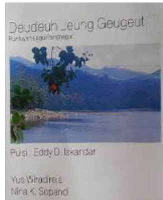
Gambar 3. 1 Album Kawih Deudeuh jeung Geugeut