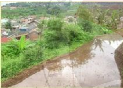
Pelestarian Budaya Sunda