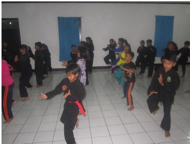
Gambar 117 Latihan (Foto : Elvara, 2018)