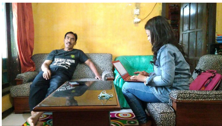
Gambar 118 Wawancara Kepada Narasumber