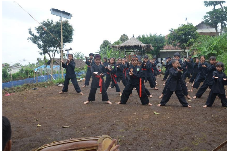
Gambar 115 Latihan