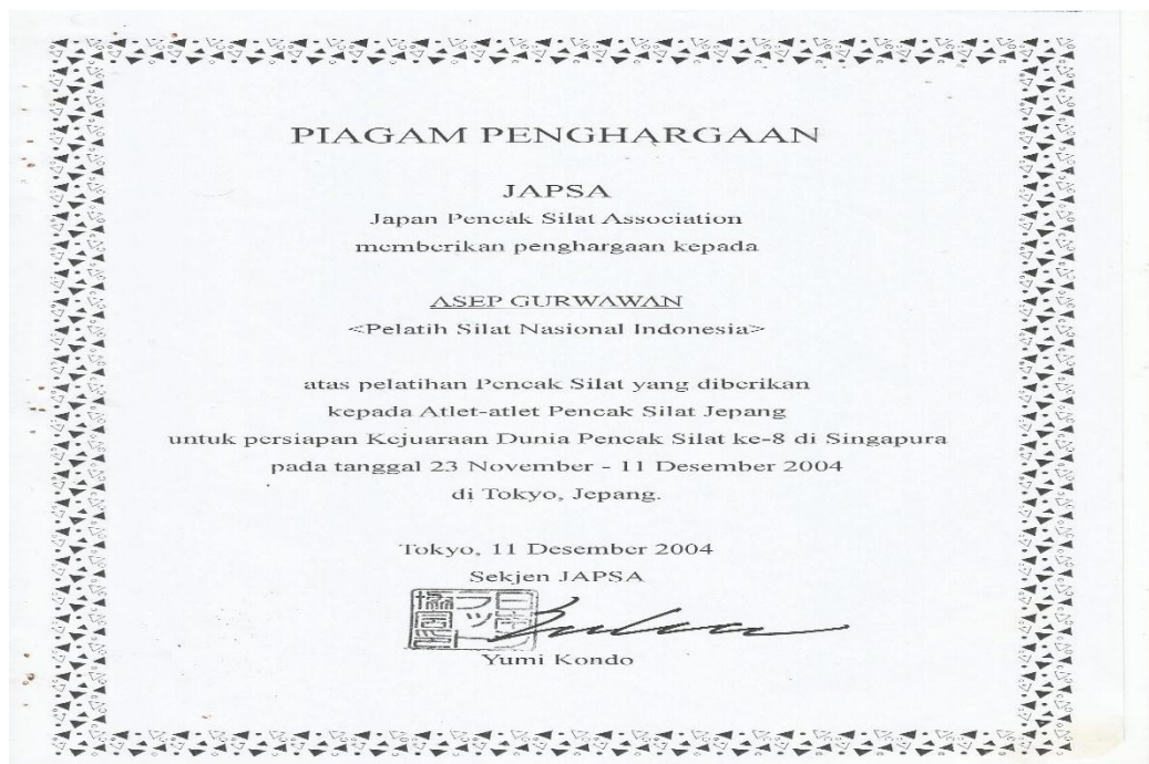
Gambar 113 Sertifikat Asep Gurwawan