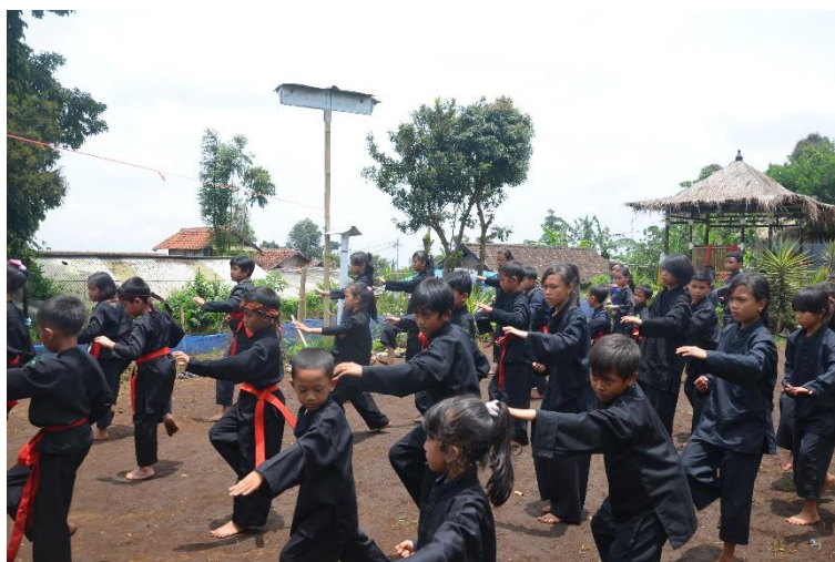
Gambar 114 Latihan

Elvara Azizah Intania Yahdi, 2013 IBING BEDOG DI PANGLIPUR PAMAGER SARI KABUPATEN BANDUNG BARAT