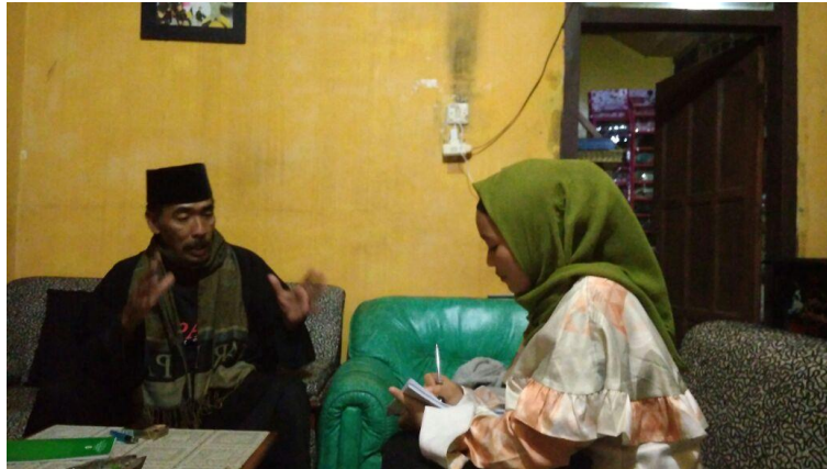
Gambar 119 Wawancara Kepada Narasumber