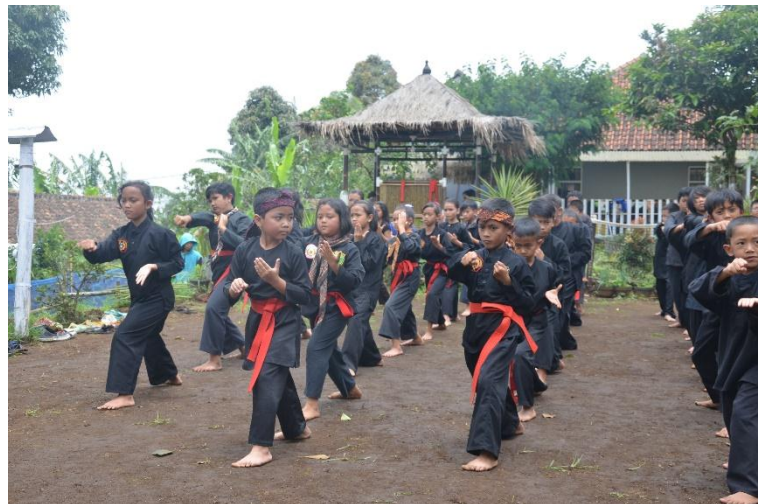
Gambar 116 Latihan