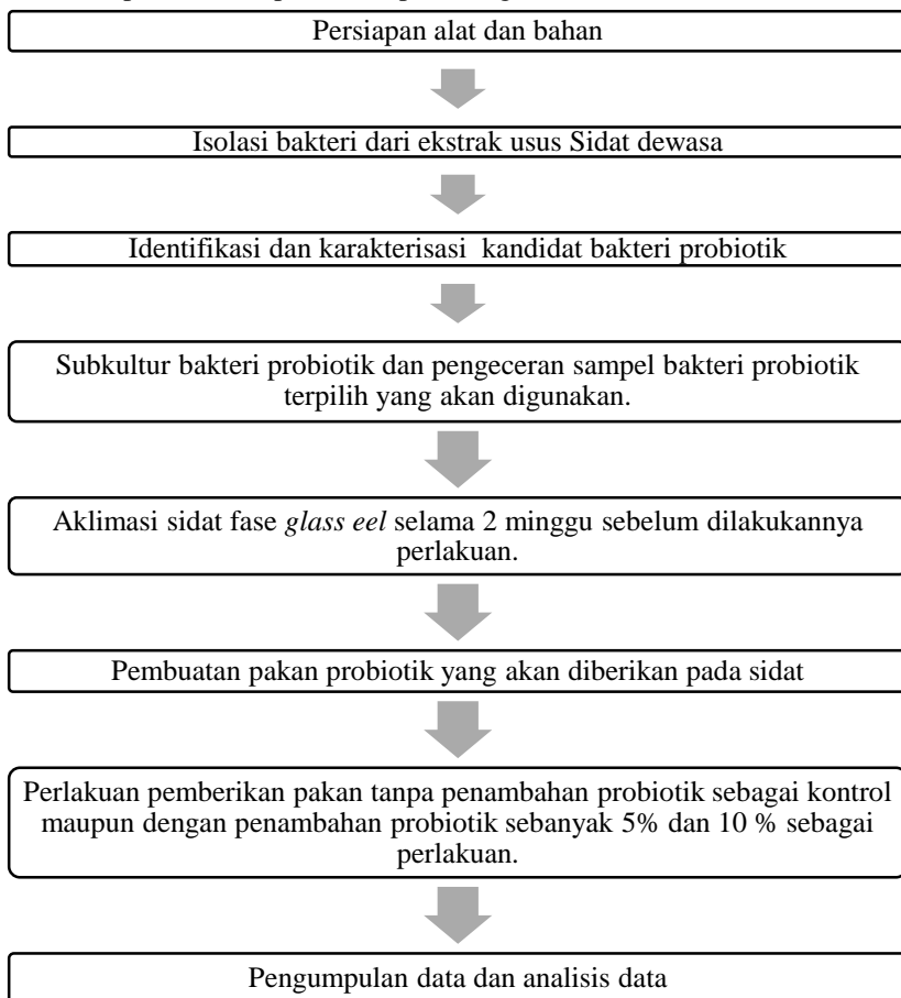
Gambar 3.2 Diagram Alur Penelitian

Alur penelitian dapat dilihat pada diagram alir di bawah ini :