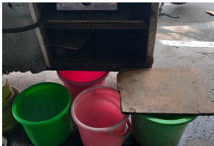
Tempat penyimpanan air bersih