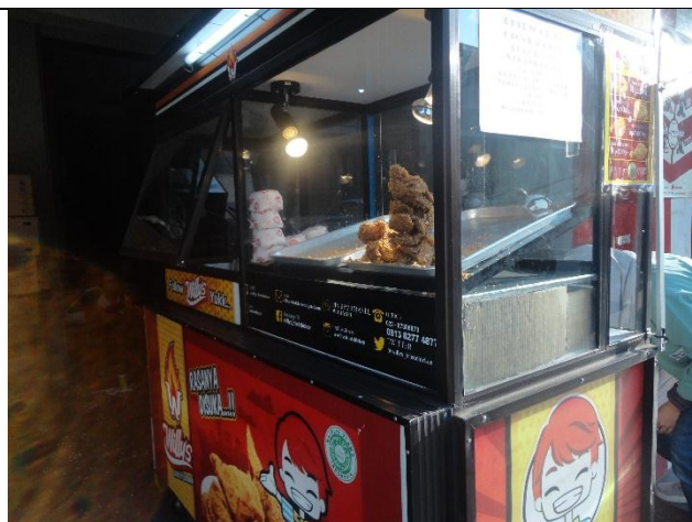
Gerobak dalam keadaan bersih