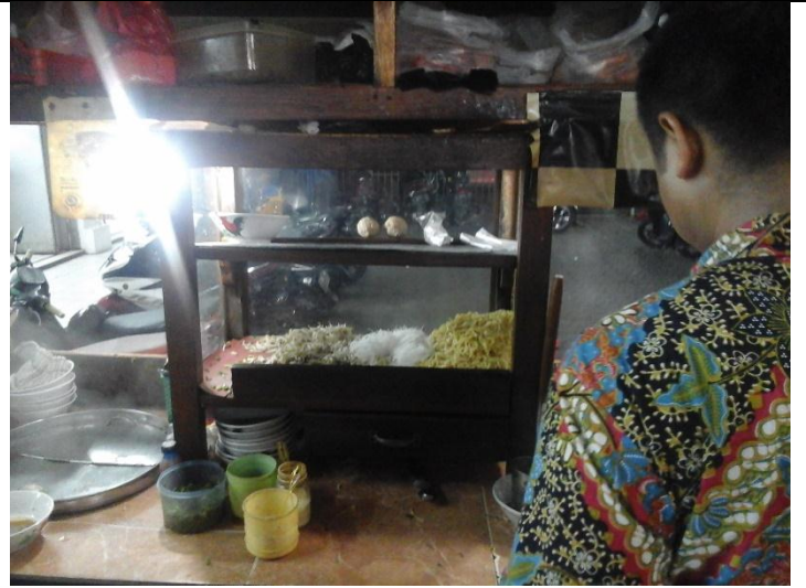
Tempat penyimpanan makanan tidak tertutup