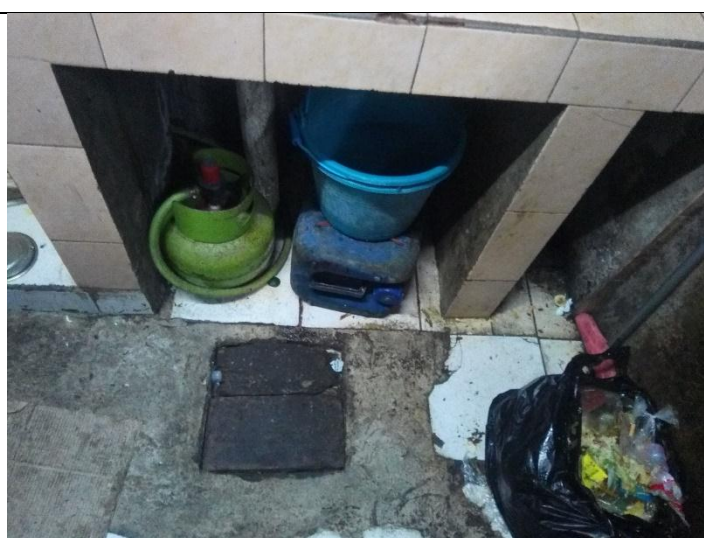
Bagian bawah tempat pencucian peralatan