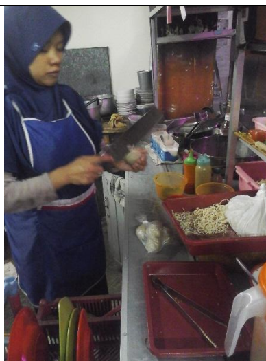
Responden menggunakan celemek ketika mengolah makanan