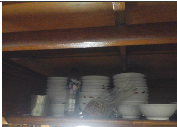
Tempat penyimpanan peralatan makan tertutup