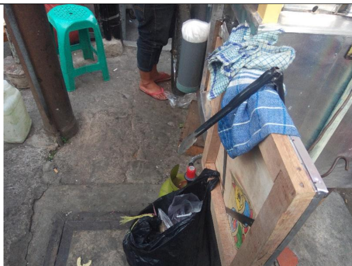
Lap dan capitan di simpan dimana saja.