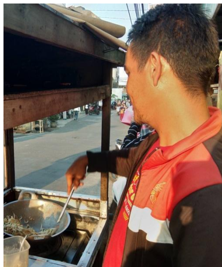
Responden sedang melakukan pengolahan