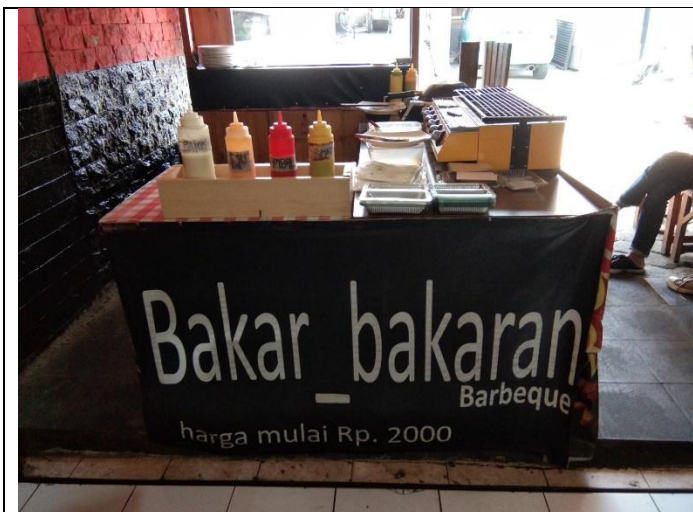
Tempat pedagang semi permanen