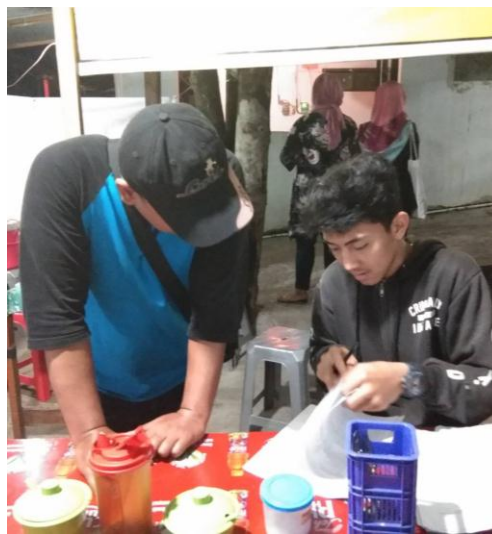
Penulis sedang melakukan pengarahan kepada