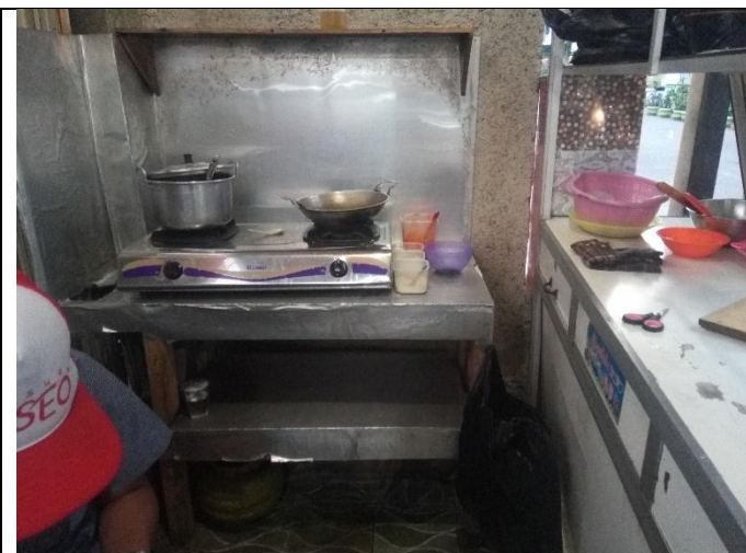
Area mengolah dan membungkus makanan