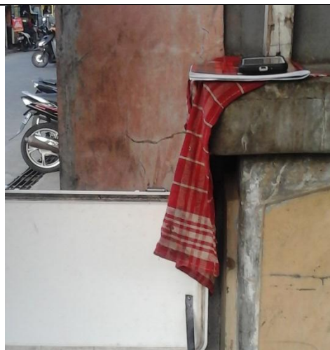
Lap ditaruh dimana saja