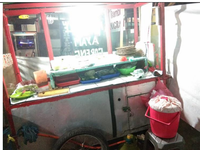
Sisi dalam gerobak untuk menaruh makanan yang dijual