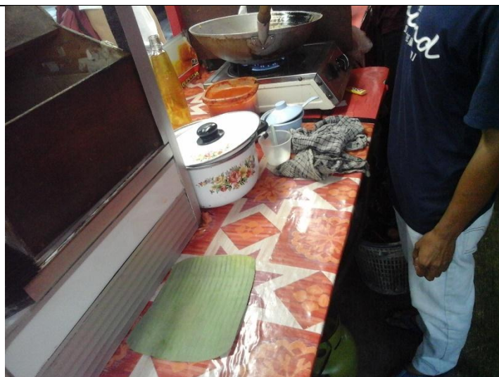
Tempat mengolah makanan dalam keadaan bersih