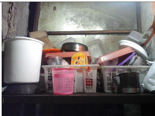
Tempat penyimpanan peralatan dalam keadaan berantakan