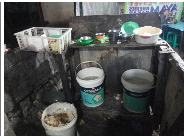
Tempat pencucian kurang memadai dan dalam keadaan kotor