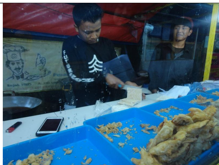
Makanan matang dibiarkan terbuka