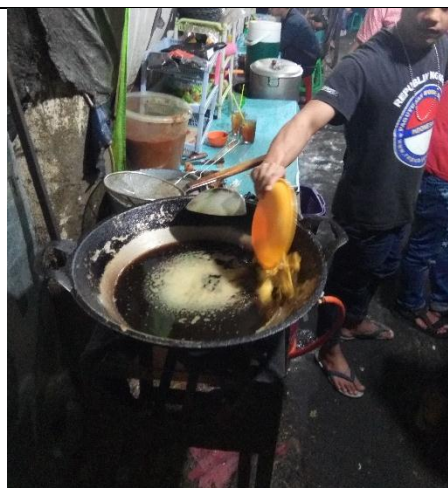
Responden sedang mencampurkan minyak curah pada katel