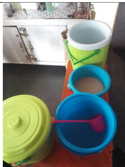
Tempat penyimpanan air bersih