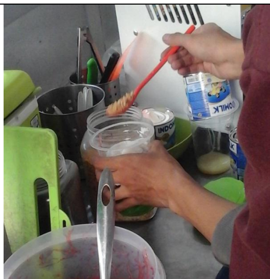
Mengambil makanan menggunakan alat bantu dan dalam keadaan bersih