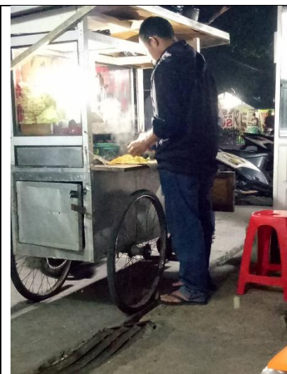
Responden sedang mengolah makanan