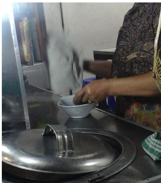
Responden sedang mengelap mangkok yang telah dicuci