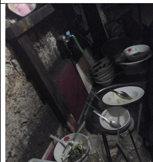
Peralatan yang sudah digunakan tidak langsung dibersihkan