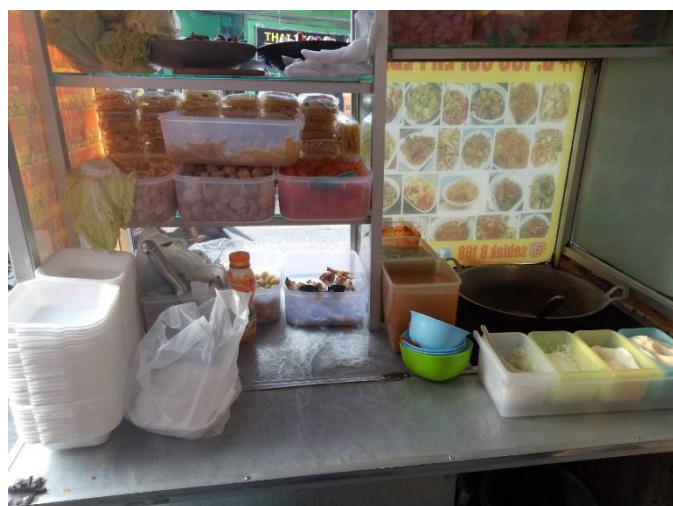
Tempat penyimpanan makanan dalam keadaan bersih