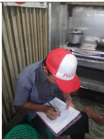
Responden sedang mengisi angket dan tes.