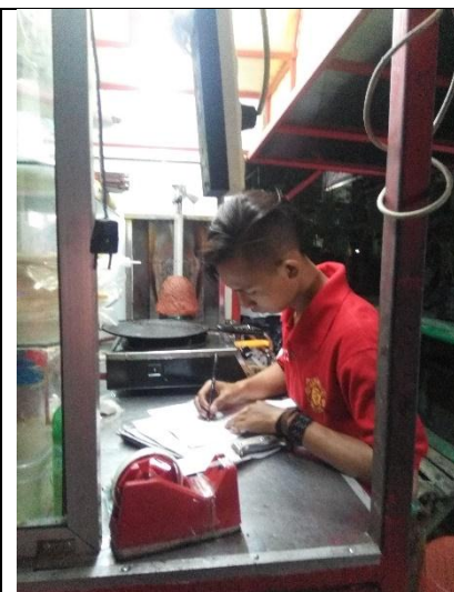
Pemberiana tes dan angket kepada responden