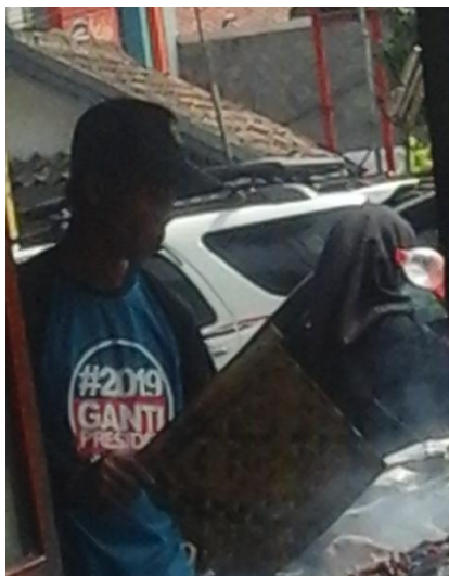
Responden sedang merokok ketika membakar