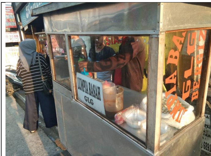
Keadaan gerobak dalam keadaan bersih