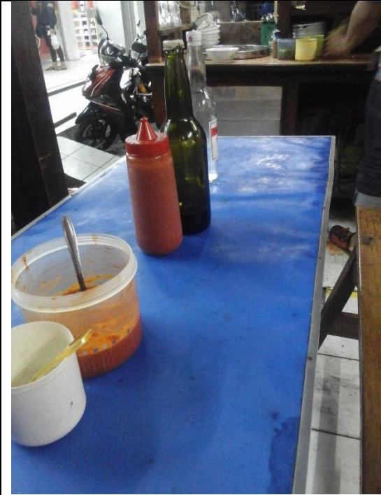
Meja untuk pembeli yang makan di tempat dalam keadaan bersih