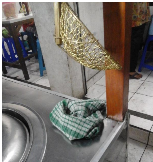
Lap yang digunakan dalam keadaan bersih