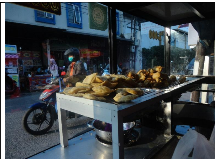
Makanan matang dibiarkan terbuka