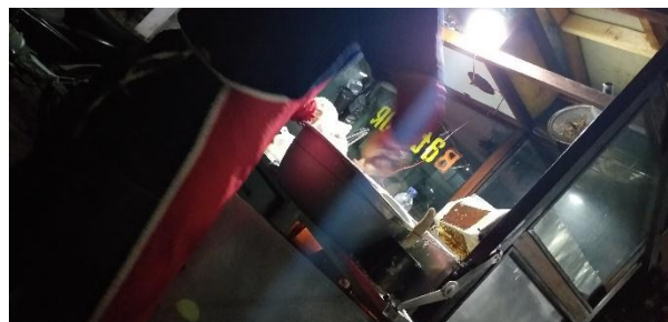
Responden menggunakan celemek dan sarung tangan pelastik pada saat mengolah makanan