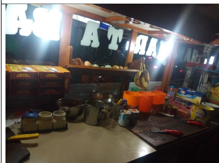
Tempat untuk menaruh makanan dalam keadaan bersih