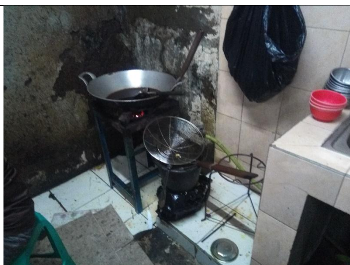
Minyak yang dipergunakan dalam keadaan hitam