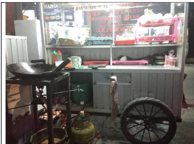
Gerobak dalam keadaan bersih