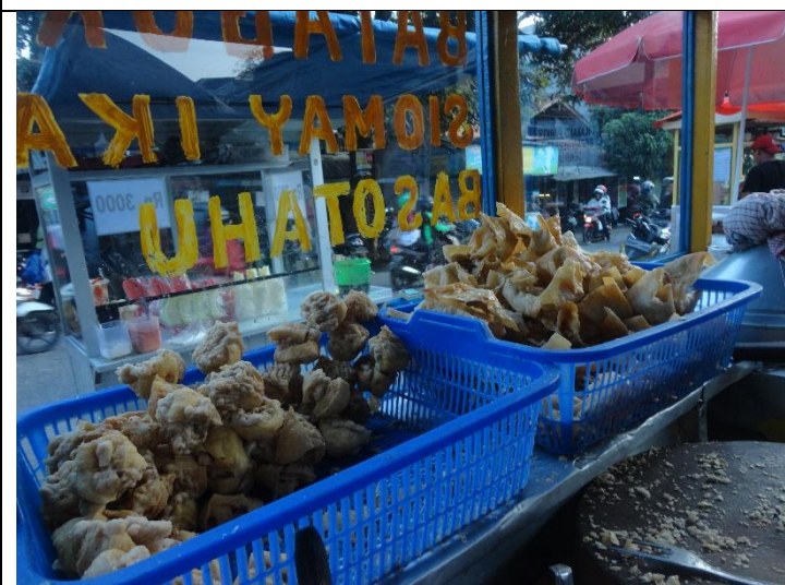
Makanan matang dibiarkan terbuka