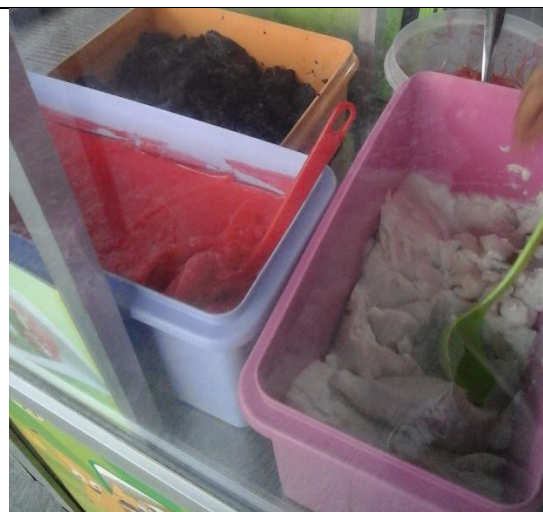
Tempat penyimpanan makanan dalam keadaan bersih