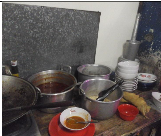
Tempat penyimpanan peralatan dan makanan dibiarkan terbuka