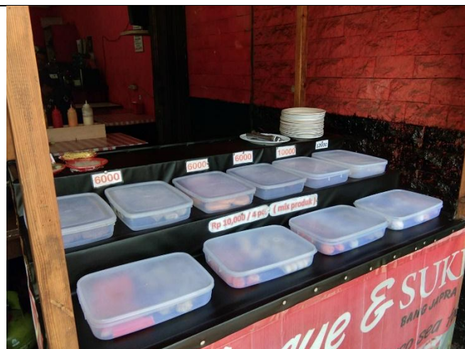
Makanan disimpan dalam wadah yang bersih dan terpisah sesuai dengan jenisnya.