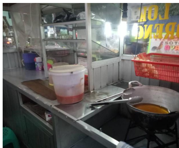
Tempat pengolahan makanan dalam keadaan bersih