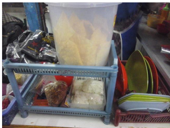
Tempat penyimpanan peratan beralih fungsi dan peralatan dibiarkan terbuka