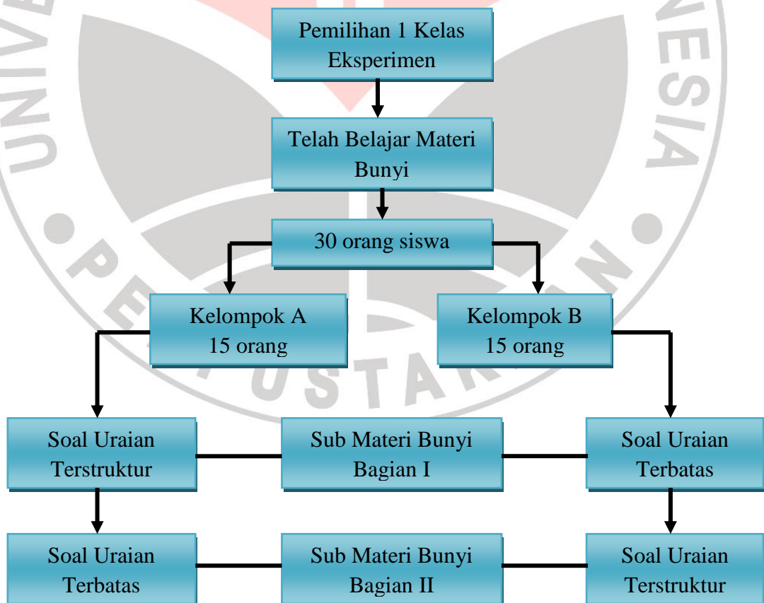
Gambar 3.1 Ilustrasi Alur Kegiatan Pengambilan Data

submateri yang sama dengan kelompok A mendapatkan jenis soal uraian terstruktur dan kelompok B mendapatkan jenis soal uraian terbatas. Setelah itu kedua kelompok beristirahat selama 20 menit, kemudian siswa yang sama kembali melakukan tes kembali tetapi pada submateri yang berbeda dari tes pertemuan pertama. Pada tes pertemuan kedua penulis melakukan teknik silang pada jenis soal yang akan diberikan yaitu kelompok A mengerjakan jenis soal uraian terbatas dan kelompok B mengerjakan jenis soal uraian terstruktur. Hal ini dilakukan agar tidak terjadi bias pada subjek kedua kelompok saat penganalisan data. Alur kegiatan pengambilan data yang dilakukan dapat di ilustrasikan seperti pada gambar 3.1.