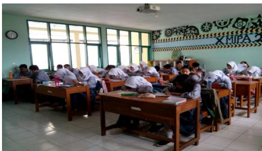
Gambar Lampiran 4.1 Pelaksanaan Tes Diagnostik Model Mental Larutan Penyangga