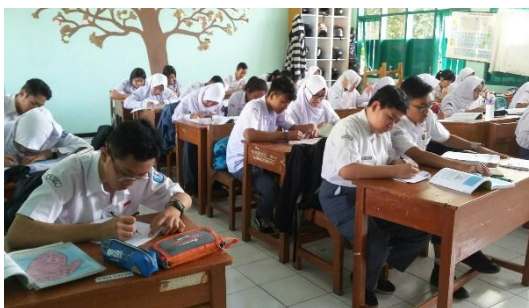
Gambar Lampiran 4.3 Pelaksanaan Kuisisioner Sikap Terhadap Pembelajaran Kimia