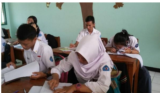
Gambar Lampiran 4.2 Pelaksanaan Tes Kemampuan Berpikir Logis