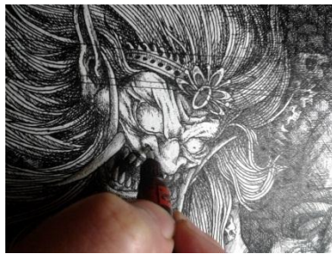
Gambar 3.10 Proses Detailing

Pada tahap ini dilakukan pendetailan pada objek gambar sehingga gambar dapat terlihat lebih berkarakter menggunakan pena ukuran 0,10 dan 0,30.