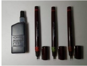
Gambar 3.4 Rapido Pen dan Tinta

Penggunaan rapido pen ukuran 0,50, 0,30, dan ukuran 0,10 diperuntukkan penyelesaian karya secara keseluruhan. Dan tinta khusus diperuntukkan apabila isi pena telah habis.