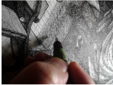
Gambar 3.9 Proses Pemberian Shading (Sumber: Karya Penulis)