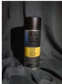
Gambar 3.5 Fixative

Penggunaan fixative digunakan agar goresan tinta hitam pada kertas terlihat lebih pekat serta permukaan karya akan terlindungi dan tahan lama.