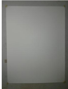
Gambar 3.2 Kertas Aquarelle A2

Kertas aquarelle merk winsor & newton 300 gram yang seharusnya diperuntukkan untuk kebutuhan cat air namun penulis menggunakan kertas aquarelle A2 ini dengan alasan karena kertas aquarelle lebih tebal, kuat, lentur, dan daya serap tinta yang kuat.