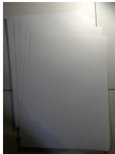
Gambar 3.1 Kertas Sketsa A3

Penulis menggunakan kertas sketsa ukuran A3 sebagai media untuk membuat sketsa kasar untuk kemudian dipindahkan pada kertas kerja yang berukuran lebih besar.