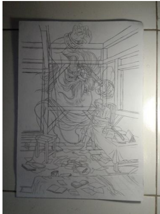
Gambar 3.6 Sketsa Karya Bunuh Diri

drawing kisah kematian meliputi ilustrasi tokoh makhluk pencabut nyawa, bagaimana manusia mati dan seting dimana manusia tersebut mati.