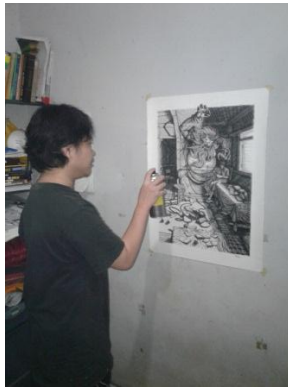
Gambar 3.11 Pemberian Fixative

Rizky Rahayu Abdurrahman, 2018 KISAH KEMATIAN DALAM DRAWING