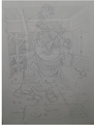
Gambar 3.7 Pemindahan Sketsa di Kertas Kerja