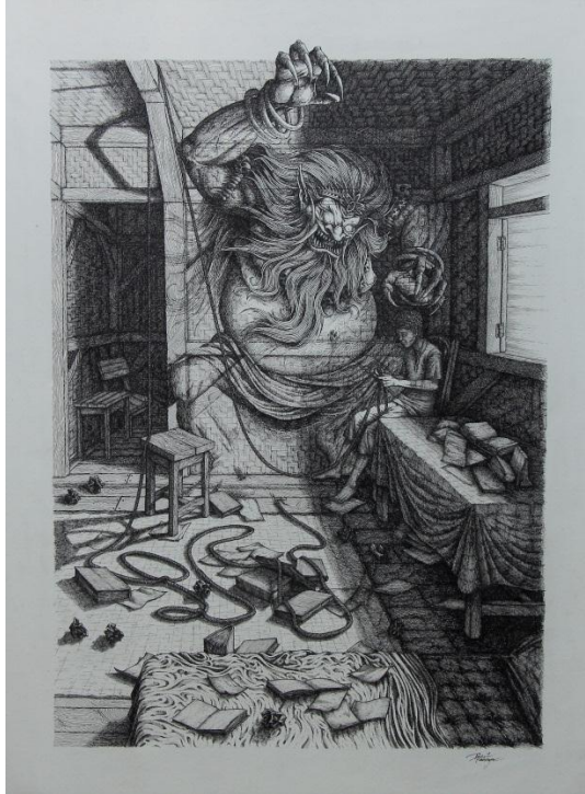
Gambar 3.12 Hasil Akhir Karya