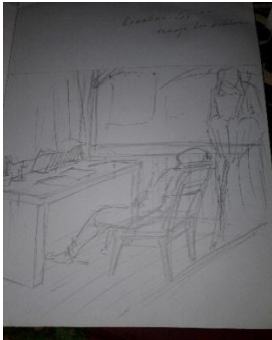
Studi Karya ke-6