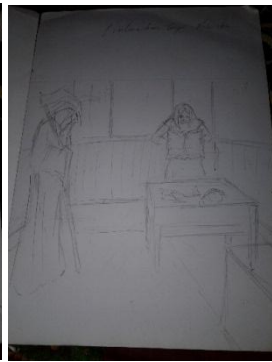
Studi Karya ke-3