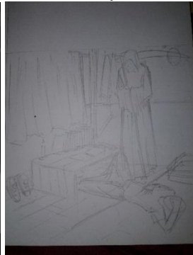
Studi Karya ke-6