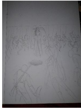
Studi Karya ke-2