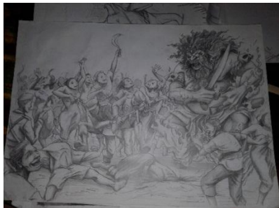
Studi Karya ke-2