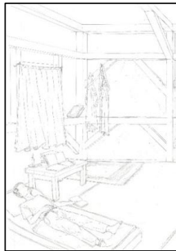
Sketsa Karya ke-6