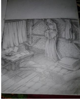
Studi Karya ke-6