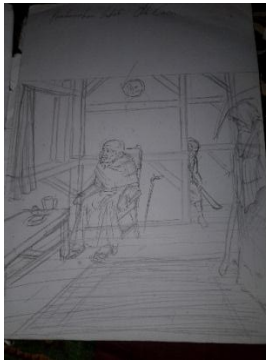
Studi Karya ke-2