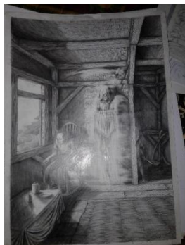
Studi Karya ke-2 (Sumber: Karya Penulis)