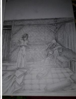
Studi Karya ke-3