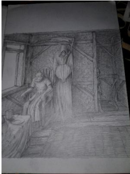
Studi Karya ke-2