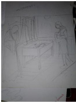
Studi Karya ke-3