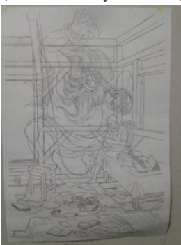
Sketsa Karya ke-1 (Sumber: Karya Penulis)