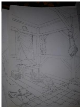
Studi Karya ke-6 (Sumber: Karya Penulis)