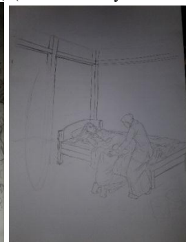
Studi Karya ke-5