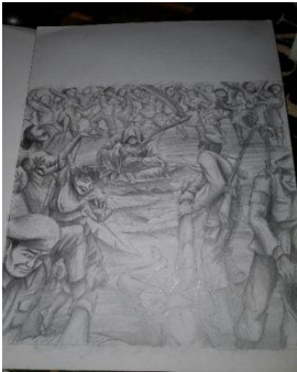
Studi Karya ke-2