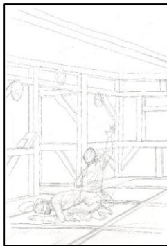
Sketsa Karya ke-4