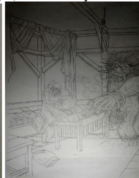
Sketsa Karya ke-3