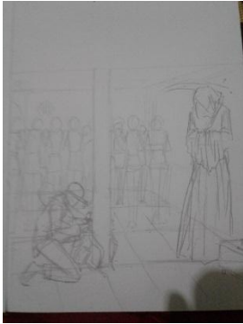
Studi Karya ke-4