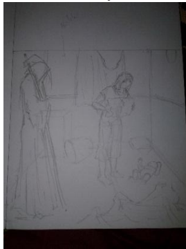
Studi Karya ke-3