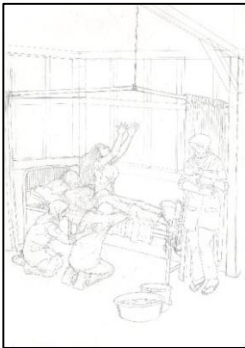
Sketsa Karya k