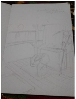
Studi Karya ke-4