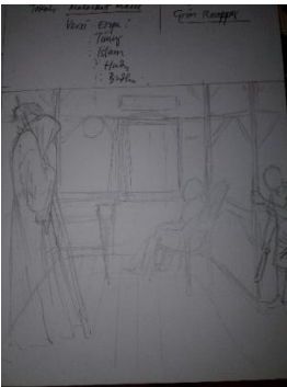
Studi Karya ke-2