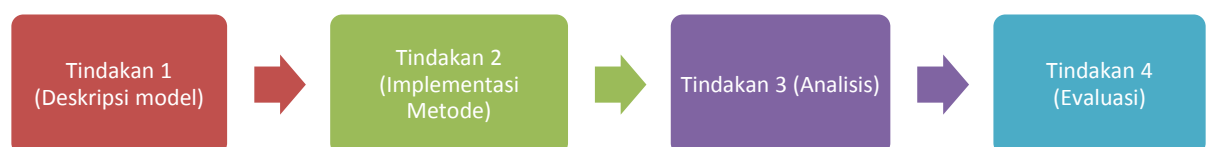
Gambar 3.1 Pelaksanaan tindakan

Metode penelitian yang akan digunakan dalam penelitian “Penerapan Model Cooperative Tipe NHT (Numbered Head Together) dalam Pembelajaran IPS Untuk Meningkatkan Metakognisi Siswa” adalah Penelitian Tindakan Kelas (PTK). Penelitian yang akan dilaksanakan beberapa siklus dan setiap siklusnya terdiri dari empat tindakan.