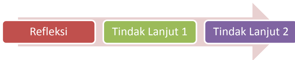
Gambar 3.3 Tahapan Refleksi

Dalam penelitian ini, refleksi yang dilakukan terdiri dari beberapa tahapan yaitu: