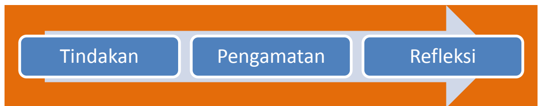
Gambar 3.4 Klasifikasi pelaksanaan siklus

Penelitian ini dilakukan dalam tahapan siklus. Dimana secara umum gambaran siklus yang dilakukan tergambar pada skema di bawah ini