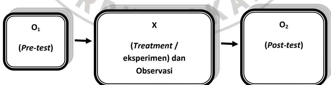
Gambar 3.1 Desain Penelitian

Metode penelitian yang digunakan dalam penelitian ini adalah metode quasi eksperimen atau eksperimen semu atau eksperimen yang tidak sebenarnya dengan menggunakan satu sampel penelitian yaitu hanya kelompok eksperimen saja tanpa kelompok pembanding atau kelompok kontrol. Adapun desain penelitian yang digunakan adalah One Group Pre-test-Post-test Design . Desain ini adalah suatu rancangan pre-test dan post-test yang dilaksanakan pada satu kelompok saja tanpa pembanding. Di dalam desain ini pengukuran dilakukan sebanyak dua kali yaitu sebelum eksperimen disebut pre-test dan sesudah eksperimen disebut post-test (Arikunto, 2006:85). Desain penelitian tersebut dapat digambarkan pada gambar di bawah ini: