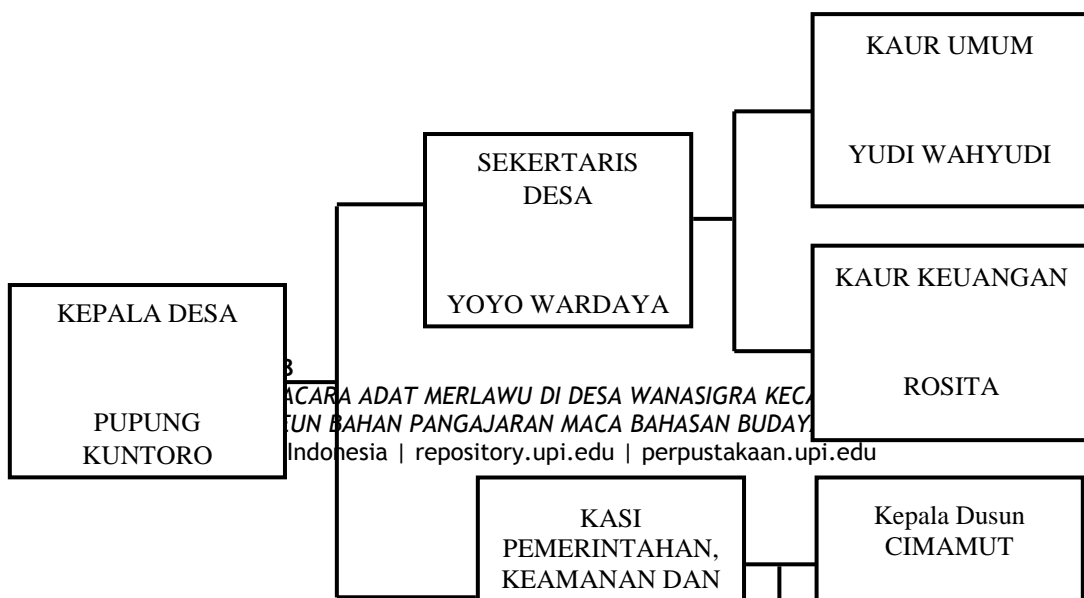
Bagan 3.2 SUSUNAN ORGANISASI PAMERINTAH DESA DESA WANASIGRA KECAMATAN SINDANGKASIH