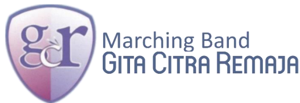
Gambar 3.3.1 Lambang Gita Citra Remaja