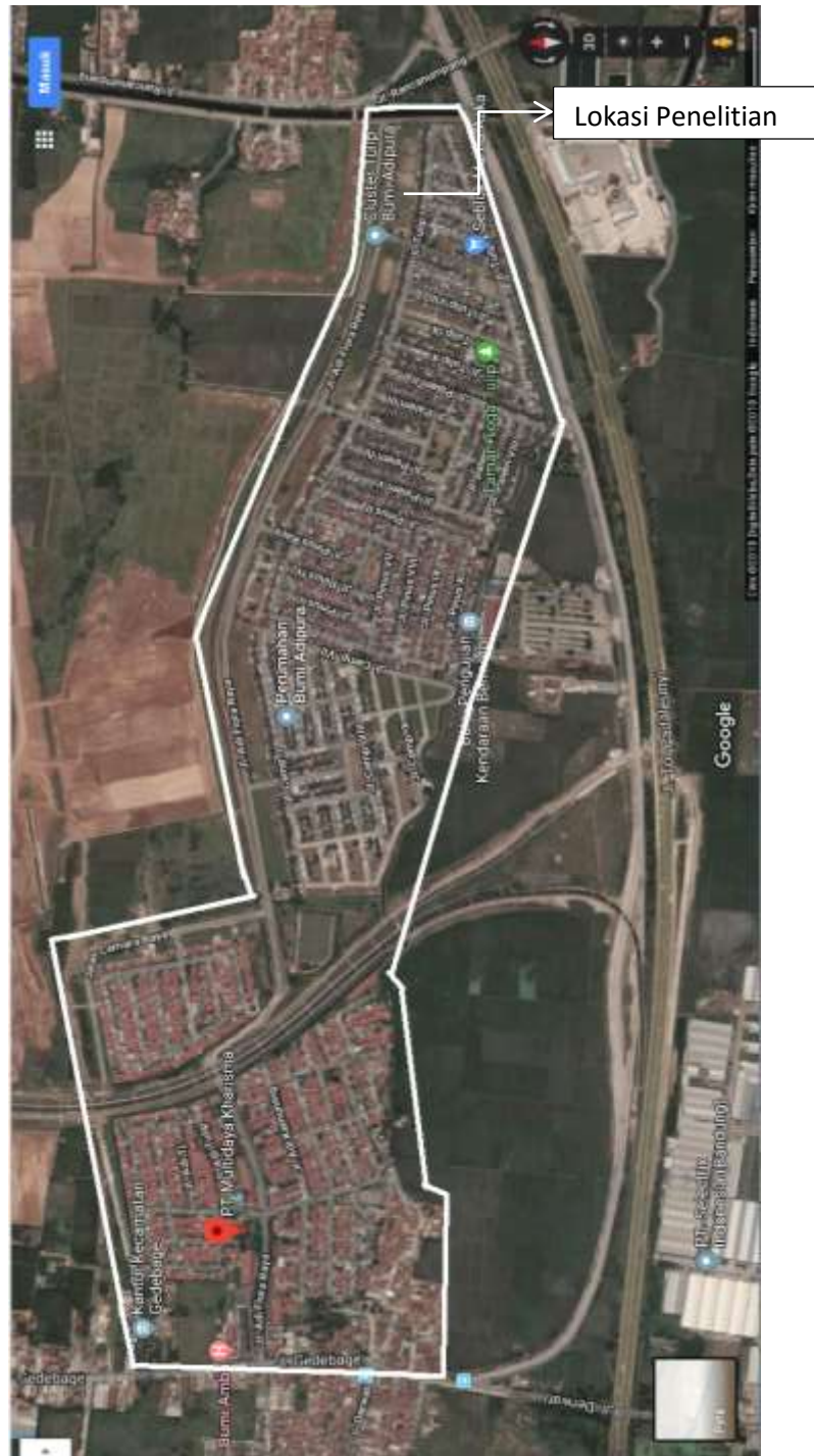
Gambar.3.1. Peta Lokasi Penelitian