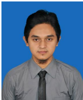
Gambar 1 Pelatih PSM UPI