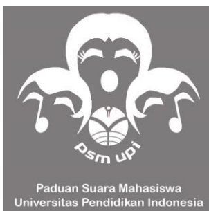
Gambar 2 Logo PSM UPI

Penelitian ini dilaksanakan di Kampus Universitas Pendidikan Indonesia, Bandung. Tepatnya di Ruang 30, lantai 4 gedung FPBS UPI Bandung. Narahubung: 085797580566 dapat juga diakses melalui media sosial elektronik Twitter dengan nama pengguna @psmupibdg dan alamat email psmupibdg@gmail.com.