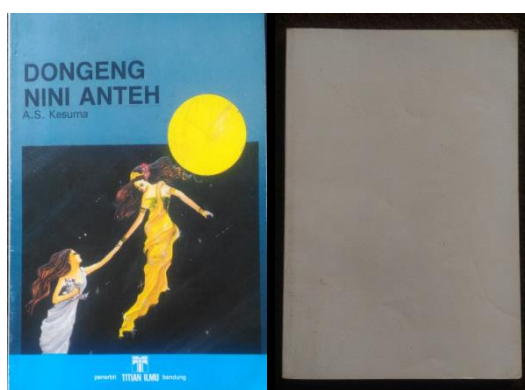
Gambar 3. 1 Jilid Buku Dongeng Nini Anteh