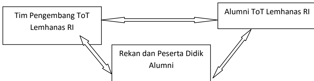
Gambar 3.1 Triangulasi Sumber

berbeda dan data yang spesifik dari ketiga sumber tersebut. Setelah itu dianalisis oleh peneliti, dan dibuat kesimpulan. Selanjutnya setelah selesai di simpulkan, dimintakan kesepakatan kepada ketiga sumber tersebut.