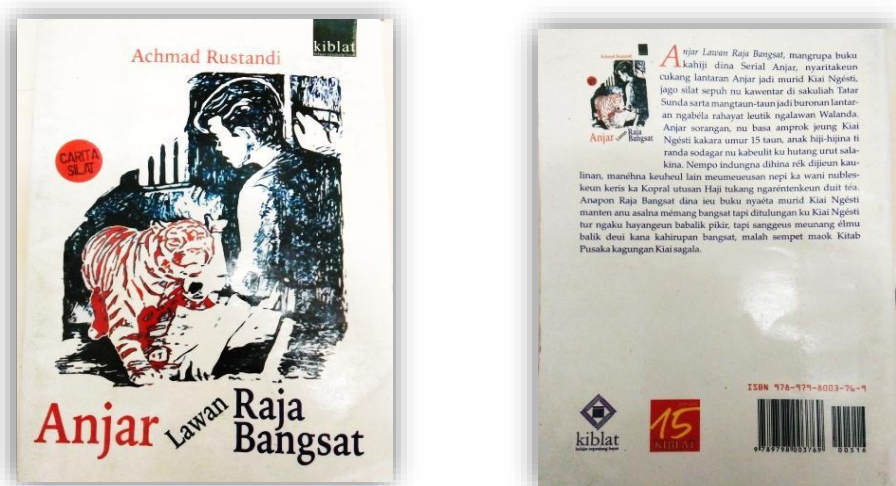
Gambar 3. 1 Jilid Hareup jeung Tukang Novel

Novel Anjar Lawan Raja Bangsat ngawengku lima épisode. Épisode kahiji (kaca 5-19) nyaritakeun tokoh Anjar nu apruk-aprukan ka leuweung ku sabab hayang salamet ti Juragan Haji katut ajudan-ajudanna nepi ka manéhna papanggih jeung Kiai Ngésti tuluy diaku anak, tuluy diajarkeun élmu penca. Épisode kadua (kaca 20-25) nyaritakeun kaayaan Kiai Ngésti ti mimiti ka Tanah Jawa ngulik buku pusaka nepi ka ngulik élmu penca. Épisode katilu (kaca 26-35) nyaritakeun Kiai Ngésti rék ngajarkeun élmu penca ka Anjar jeung kacaritakeun Anjar geus