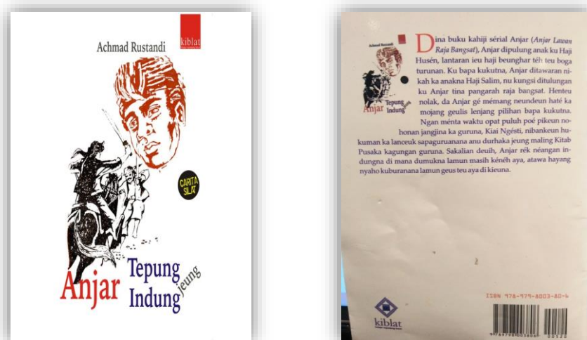
Gambar 3. 2 Jilid Hareup jeung tukang Novél

Novel Anjar Tepung jeung Indungna ngawengku lima épisode. Épisode kahiji (kaca 5-23) nyaritakeun yén Anjar téh katitipan amanat ku Ambu jeung Ama salaku indung jeung bapa angkatna, yén Haji Salim ngajak bébésan. Ti