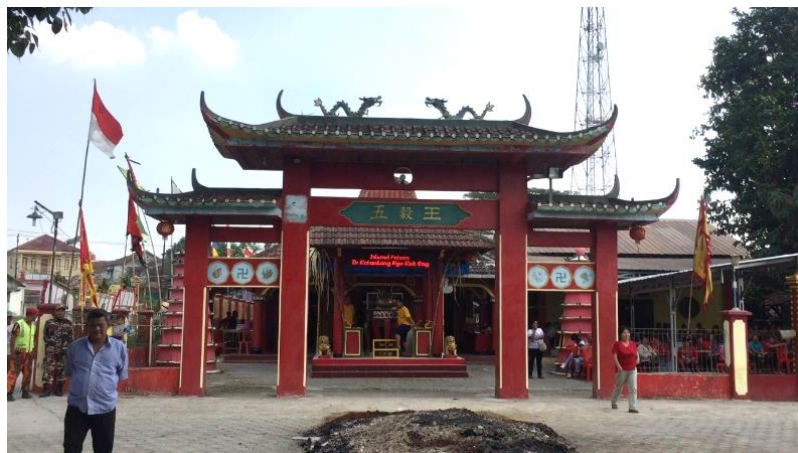
Gambar 3.2 klenteng Ngo Kok Ong

Subjek penelitian yaitu pertunjukan kesenian gambang kromong , dalam penataan panggung, pertunjukannya terdapat struktur pertunjukan, instrument apa saja yang digunakan dan materi lagu klasik dan modern yang di bawakan kemudian dianalisis sesuai dengan rumusan masalah yang di tentukan. Objek penelitian yaitu pimpinan kesenian gambang kromong Om Uki. Peneliti mendeskripsikan bagaimana riwayat dan penyajian kesenian gambang kromong grup Savera Entertainment di Klenteng Ngo Kok Ong Cibarusah Kabupaten Bekasi.