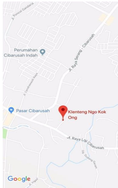
Gambar 3.1 Denah lokasi klenteng Ngo Kok Ong

Subjek penelitian yaitu pertunjukan kesenian gambang kromong , dalam penataan panggung, pertunjukannya terdapat struktur pertunjukan, instrument apa saja yang digunakan dan materi lagu klasik dan modern yang di bawakan kemudian dianalisis sesuai dengan rumusan masalah yang di tentukan. Objek penelitian yaitu pimpinan kesenian gambang kromong Om Uki. Peneliti mendeskripsikan bagaimana riwayat dan penyajian kesenian gambang kromong grup Savera Entertainment di Klenteng Ngo Kok Ong Cibarusah Kabupaten Bekasi.