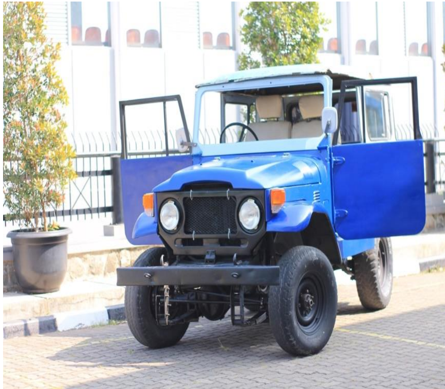
B. Tangki Bahan Bakar