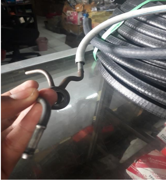
H. Selang Bahan Bakar