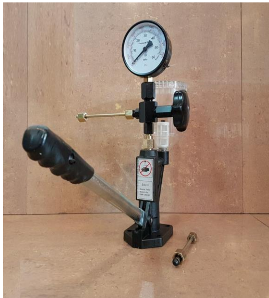
F. Injektor Tester