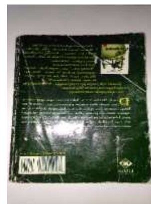
Gambar 3.2 Jilid Buku Hareup jeung Tukang

Nya éta Lebaran Poé Jumaah ngawengku 8 kaca, Abah Mandor ngawengku 14 kaca, Kiai Modin ngawengku 9 kaca, jeung Ki Merebot ngawengku 18 kaca.