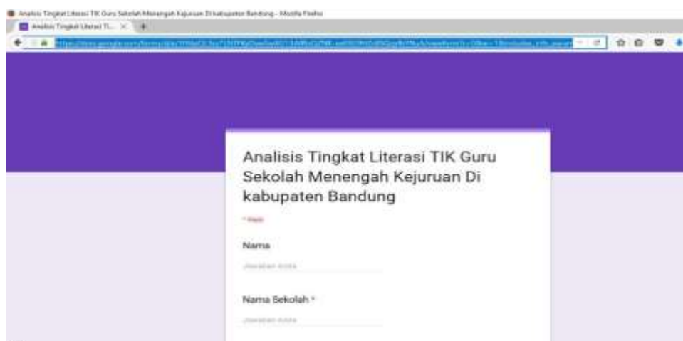
Gambar 0-3 Kuesioner menggunakan google form melalui halaman Web