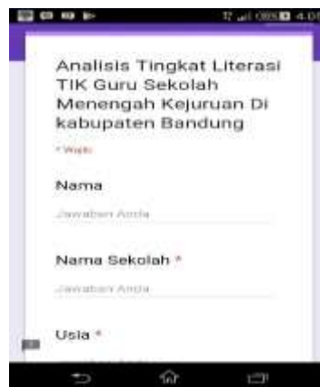
Gambar 0-2 Kuesioner menggunakan google form melalui HP Andoid

Kuesioner dibagi kedalam dua bagian. Bagian satu mengumpulkan data demografis dan terdapat pertanyaan yang mengharuskan partisipan melengkapi pernyataan. Bagian kedua berisi pertanyaan skala lickert yang dirancangan untuk menggali informasi tentang sikap dan tanggapan partisipan dalam penggunaan TIK (Moore, 2006). Data kualitatif berupa wawancara dilakukan secara langsung kepada informan, pengambilan data dirancang untuk mengeksplorasi tanggapan dan pendapat informan terhadap persepsi lebih mendalam mengenai penggunaan TIK dalam pendidikan (Probert, 2009). Data kualitatif berupa observasi di lapangan di lakukan pada sekolah yang menjadi sample penelitian untuk mendapatkan informasi tambahan terkait sarana dan prasarana yang digunakan sekolah terkait dengan penggunaan TIK di sekolah.