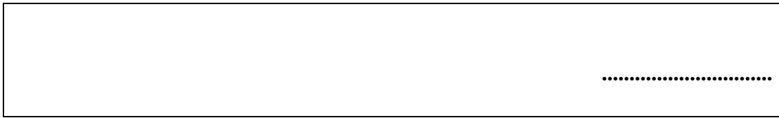
Gambar 3.3 Format lembar catatan lapangan