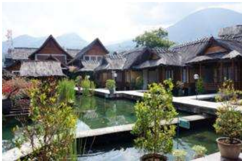
Suasana Kampung Sumber Alam Cipanas, Garut

fasilitas yang ada pada Babakan Siluhur memiliki kapasitas untuk 12 orang, dilengkapi dengan fasilitas private aqua medic pool dan pavilion . Sementara kamar lainnya memiliki kapasitas standar dan variatif.