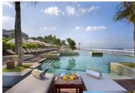
The Seminyak Beach Resort and Spa