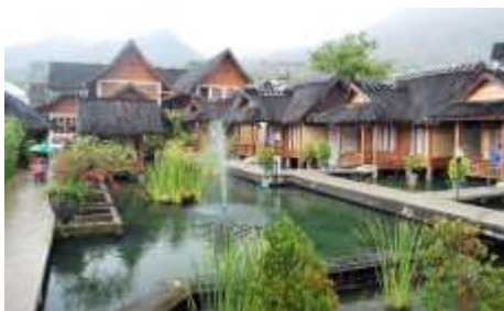
Suasana Kampung Sumber Alam Cipanas, Garut