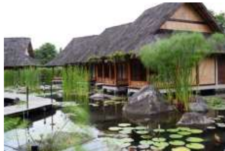
Suasana Kampung Sumber Alam Cipanas, Garut