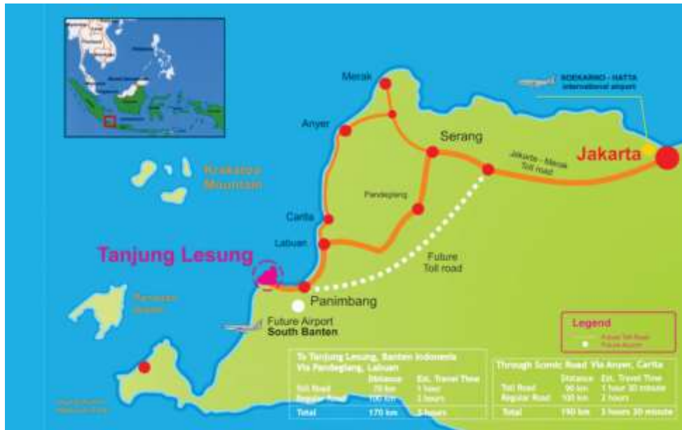
Gambar 3. 3 Peta KEK Tanjung Lesung, 2016