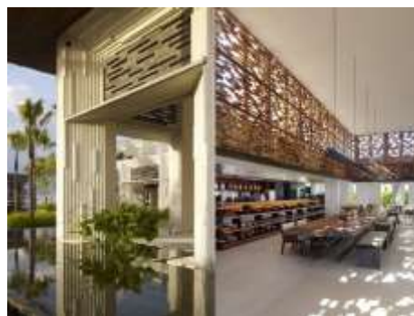
Suasana villa dari tampak depan