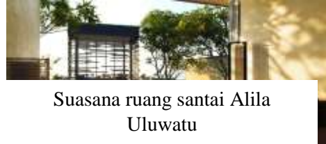
Suasana ruang santai Alila Uluwatu

Suasana ruang santai yang menghadap ke arah kolam renang