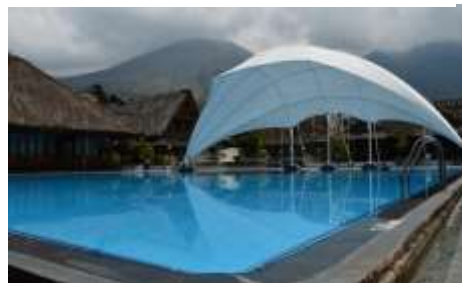
Suasana Kolam Renang Outdoor di Kampung Sumber Alam Cipanas, Garut