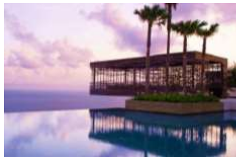
Suasana ornamen material bekas