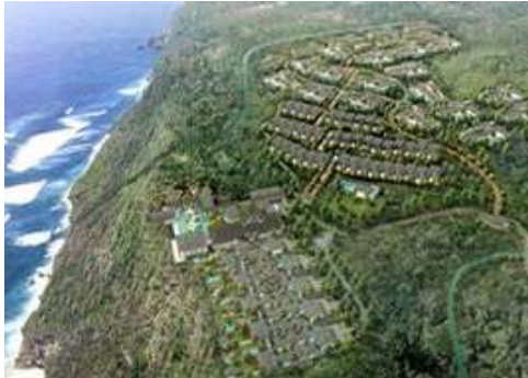
Master plan Alila Uluwatu