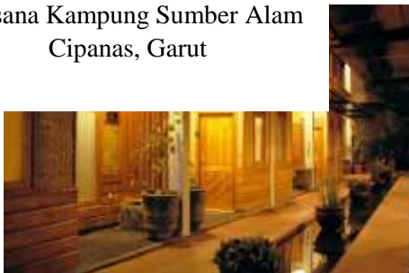
Suasana Hotel di Kampung Sumber Alam Cipanas Garut