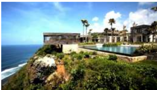
Tampak Depan Alila Uluwatu

ornamen pada bangunan. Alila Uluwatu Eco Resort memiliki 84 villa yang memberikan suasana yang privat, nyaman dan memberikan view maksimal. Arsitek menyatukan ruang dalam dan runag luar dengan membuat ruang transparan, memberikan elemen kaca sebagai pembatas ruang, sehingga ruang publik dan privat menjadi satu. Penggunaan elemen kayu bekas yang diperoleh bekas rel kereta api digunakan pada pembuatan ornamen pada tampak bangunan dan beberapa furnitur. Pemilihan material memperhatikan batasan tertentu untuk mengurangi carbon-footprint . Pada Alila Uluwatu, konsep yang dipakai pada perancangan ini adalah berkelanjutan , dimana sistem yang digunakan mengacu pada prinsip berkelanjutan yaitu menggunakan sistem water recycling , renewable energy dan passive solar design Dalam rancangan Alila Uluwatu menggunakan material kayu bekas yang berasal dari penduduk sekitar dan lahan. Bentuk respon pada tapak ditunjukan dengan orientasi, villa diarahkan menuju pantai, karena lokasi proyek berada di tebing, bentuk desain bangunan adalah bangunan modern.