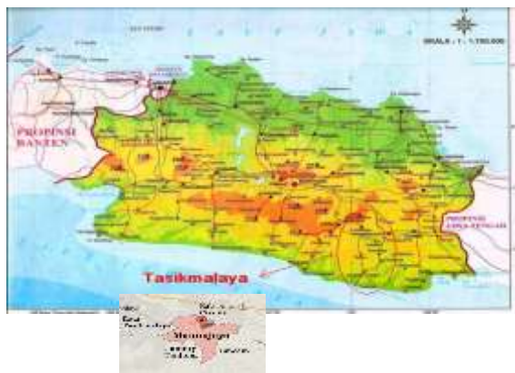
Gambar 3.2 Péta Lokasi Panalungtikan

Tempat panalungtikan ieu dilaksanakeun nya éta di Désa Manonjaya Kecamatan Manonjaya Kabupatén Tasikmalaya.