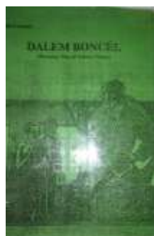
Gambar 3.1 Jilid Dongéng Dalem Boncél