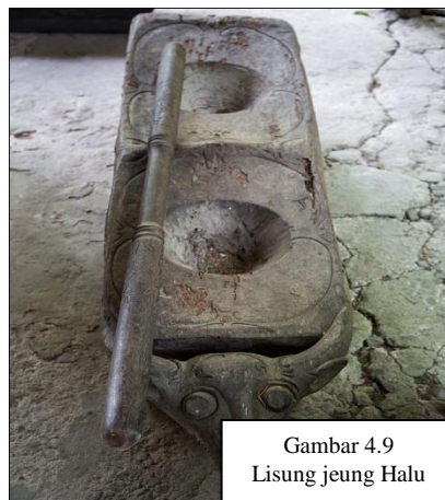
Gambar 4.9 Lisung jeung Halu

Lisung jeung halu mangrupa pakakas pikeun nutu béas anu sipatna tradisional dina waktu harita. Lisung jeung halu dijieunna tina kai, lisung anu jadi dadamparna tempat béas sedengkeun halu anu jadi pameupeuhna. Lisung rupana panjang masagi anu dikerok tengahna sangkan legok, sedengkeun halu mah siga paneunggeul atawa tongkat panjang. Lisung jeung halu dina ngabungbang digunakeun dina