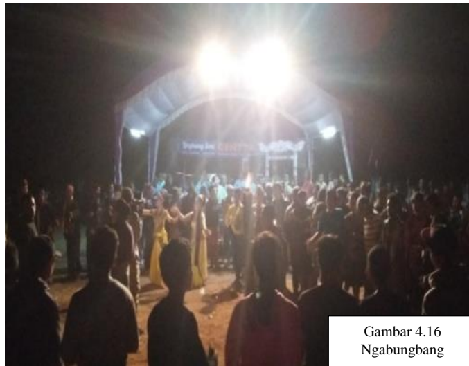
Gambar 4.16 Ngabungbang

Ngabungbang nu jadi inti tina kagiatan Upacara dina poéan pamungkas sarta sakalian jadi kagiatan panutup tina runtuyan acara Ngabungbang.