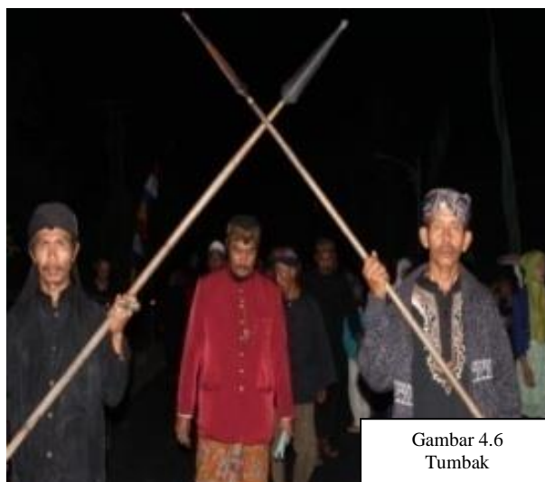
Gambar 4.6 Tumbak