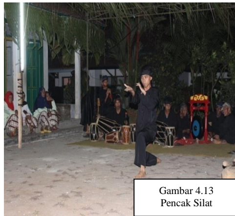
Gambar 4.13 Pencak Silat

Silat numutkeun Ki Demang Wangsyafudin asal kecapna tina solat. Ditilik sacara filosofis yén silat mangrupa cara urang salaku manusa pikeun ngabela diri tina kajahatan jeung rupaning gangguan kana diri, patalina jeung solat anu mangrupakeun tihang tina agama ngawewegan kakuatan iman tina diri manusa ngajaga tina paripolah anu keji jeung munkar.