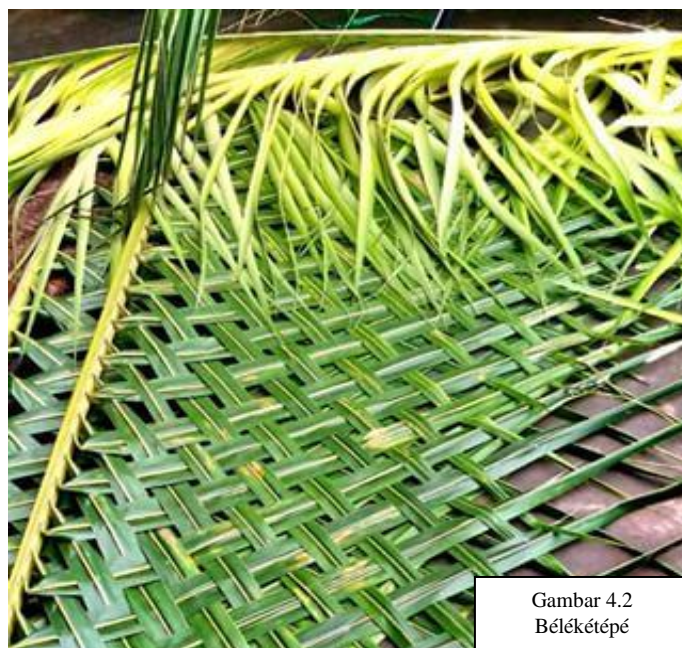
Gambar 4.2 Bélékétépé

Mangrupa anyaman tina janur pikeun dijadikeun pipinding dina panggung jeung tempat-tempat anu dijadikeun tempat dilaksanakeunna runtuyan Ngabungbang. Bélé umumna dipaké pikeun mipindingan imah saheulaaneun, pikeun suhunan saheulaaneun jeung dipaké pikeun moé opak. Dina ngabungbang kurang leuwih aya kana 40 bélé anu disadiakeun pikeun ampar tempat diuk, mipindingan panggung sarta mipindingan balandongan. Dijieunna ku masarakat jeung panitia waktu saacan prungna ngabungbang atawa keur dina