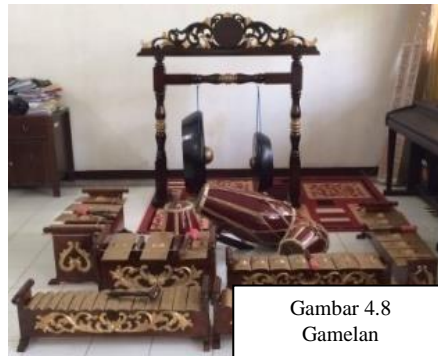
Gambar 4.8 Gamelan

Alat musik Gamelan tangtu geus umum di masarakat urang Sunda lantaran Gamelan sok mindeng dipaké dina kasenian-kasenian Sunda. Dina ngabungbang gamelan anu digunakeun meunang mawa kelompok seni ronggég, di jerona aya saron, jenglong, bonang, goong jeung kendang. Gamelanna gamelan surupan pelog. Gamelan dina ngabungbang ngan ukur dipaké dina pidangan seni ronggég nu diayakeun di lapangan désa.