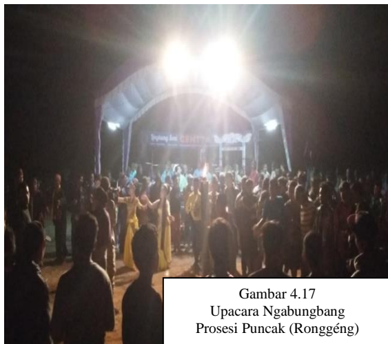
Gambar 4.17 Upacara Ngabungbang Prosesi Puncak (Ronggég)

Upacara Adat Ngabungbang mangrupa kabudayaan titipan karuhun di Batu Lawang. Ieu Upacara dilaksanakeunna unggal sataun sakali dina Bulan Mulud, tempat dilaksanakeunna aya di Desa Batu Lawang Kecamatan Pataruman Kota Banjar. Ieu upacara dilaksanakeun pikeun nepikeun rasa sukur ka pangeran