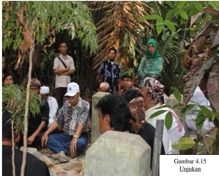
Gambar 4.15 Unjukan

Dina poé ka opat saanggeus wawangkongan, aya kagiatan anu sipatna sakral nya éta prosesi Unjukan. Prosesi Unjukan nya éta nya éta indit leumpang ka gunung ka makam luluhur batu lawang, nu aya di hulu cai anu sakaligus jadi karamatna, tempat carita ngabungbang mimiti aya anu katelahna Cikahuripan. Sugu/sasajén nu dibawa dina mangsa Unjukan nya éta tilu rupa kadaharan, aya nu ngagantung, ngagoler jeung nu kakubur, disebut ogé ku istilah “ polo gumantung, polo kesimpar, polo kependem ”. Dina Unjukan miboga tujuan pikeun sukuran sarta neda widi ka Gusti Allah SWT, ka nu ngageugeuh Batu Lawang jeung ngadu’akeun luluhur Batu Lawang. Dina Unjukan aya prosesi maca du’a nu dipingpin ku Ki Demang sarta saulas ngeunaan sajarah batu lawang. Dina Unjukan nu bisa ngaluhan ngan saukur jalma-jalma pinilih atawa ngan ukur sesepuh jeung gegedén pamaréntah hungkul nu ngalaksanakeunna. Dilaksanakeunna Unjukan dina waktu ba’da ashar, mimiti leumpang ka gunung kira-kira 15 menit lilana, tuluy ngalaksanakeun prosesina kira-kira 30 menit lilana, sanggeus éta Ki