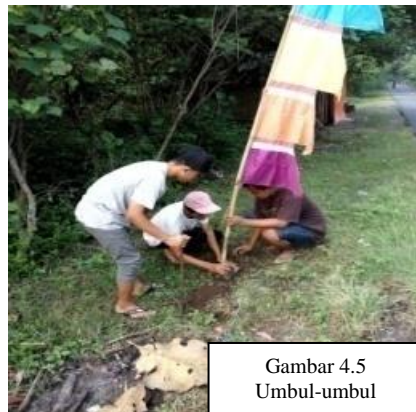
Gambar 4.5 Umbul-umbul

Umbul-umbul nya éta kélébét panjang heureut ka handap ditalikeun kana tihang (Danadibrata. 2009, kc. 726). Tihangna dijieun tina awi saleunjeur anu melengkung. Umbul-umbul dina Ngabungbang dipaké salaku dékorasi nu dijejerkeun sapanjang jalan ti buruan imah Ki Demang nepi ka lapang tempat dilaksanakeunna puncak Upacara Ngabungbang. Umbul-umbul nu dipaké dina ngabungbang lain umbul-umbul anu husus keur upacara adat, tapi umbul-umbul anu saayana anu biasana dipaké waktu 17 Agustus. Tihangna tina awi saleunjeur jenis awi tali nu geus kolot. Panjang tihangna kurang leuwih 4,5 meter. Ditancebkeunna bareng jeung nancebkeun awi konéng, ditancebkeun ku masarakat nu milu gotong royong dina kagiatan ngabungbang.