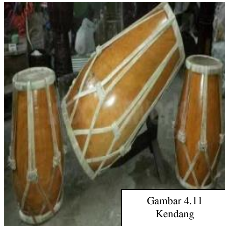
Gambar 4.11 Kendang

Kendang mangrupa alat musik anu ditabeuh , dijieunna tina kai jeung kulit. Kendang digunakeun dina kasenian Pencak Silat jeung Ronggeng Ibing. Kendang anu digunakeun dina ngabungbang aya opat, dua dipaké dina pencak silat dua deui dina pindangan ronggeng.