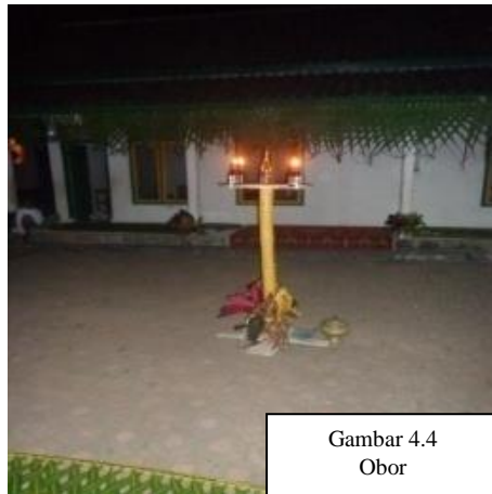
Gambar 4.4 Obor

Obor mangrupa parabot anu fungsina pikeun nyaangan nu poék. Obor dina Ngabungbang dijieunna tina tilu buku awi diliangan unggal bukuna dieusian minyak tuluy disumbuan. Panjang awi nu digunakeun keur tihangna kira-kira kana 1,20 meter. Awi anu digunakeunna nya éta awi konéng boh tihangna atawa papalang luhurna nu fungsina keur panundaan minyak. Minyak anu digunakeunna nya éta minyak tanah, tapi kusabab geus hésé diselang ku solar keur gaganti minyak tanah. Dijieunna waktu saacan prungna ngabungbang, dijieun ku para panitia katut masarakat nu milu gotong royong. Obor dina Ngabungbang digunakeun pikeun nyaangan sakabéh jalan di Batu Lawang, heuleutna aya kana tujuh meter tina unggal obor, lantaran Ngabungbang dilaksanakeunna dina waktu peuting.