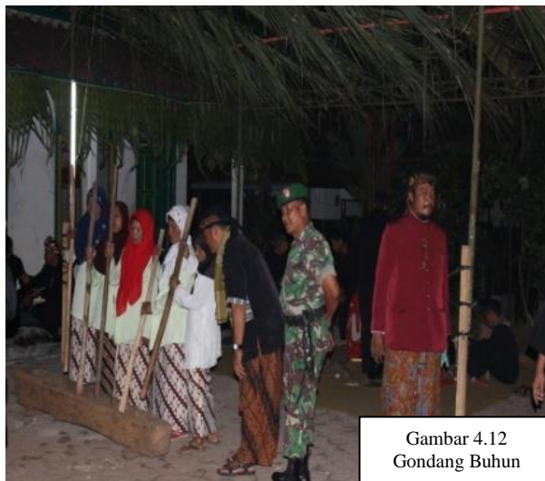
Gambar 4.12 Gondang Buhun

Gondang Buhun mangrupa seni musik tatabeuhan asli ti wewengkon Ciamis. Alat anu digunakeunna nya éta lisung jeung halu. Pamaénna aya lima urang ibu-ibu anu geus umuran, Gondang Buhun