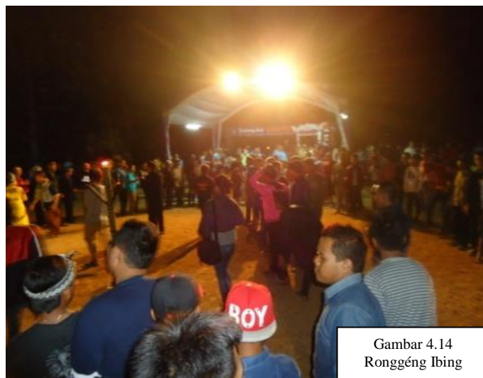
Gambar 4.14 Ronggég Ibing

Ronggég geus umum aya di masarakat urang Sunda, Ki Demang ngabédakeun ronggég jadi 2 rupa, (1) Ronggég Kaléran jeung (2) Ronggég Pakidulan. Prak-prakanna, sababaraha pamaén ronggég