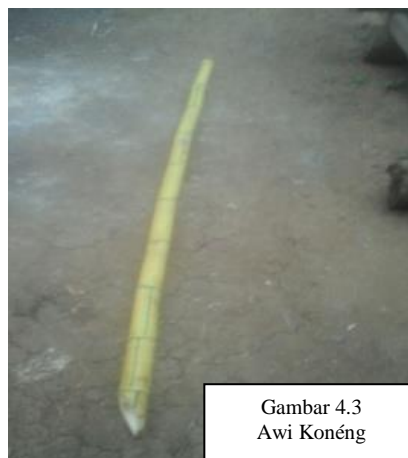
Gambar 4.3 Awi Konéng

Mangrupa tutuwuhan anu rupa tangkalna leunjeuran, bubukuan, aya mémérangan, sarta tutuwuhan nu ngaranna awi téh sok ngagumpluk anak baranakan dina sadapuran disebatna dapuran awi. Awi konéng ieu disebat ogé ampél konéng, Panjang awi anu digunakeun panjangna dua meter. Waktu dituarna mah mangrupa leunjeuran kira-kira panjangna genep meter, dipiceun ronggos awina, anu diarahna ngan ukur batang awi lebah puhu na sangkan mangrupakeun tihang nalika ditancebkeun. Awi konéng dina Ngabungbang ditancebkeun saméméh kagiatan lumangsung, nyirikeun yén rék dilaksanakeun kagiatan upacara. Awi konéng jadi ciri kusabab dina waktu harita di Batu Lawang awi konéng jadi tihang bandéra di kademangan di Batu Lawang.