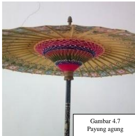
Gambar 4.7 Payung agung

Payung Agung dipaké pikeun mayungan sesepuh jeung jalma nu dipikaajrih nalika Ngabungbang dilaksanakeun, utamana mah nalika leumpang dina unggal runtuyan upacara. Payung anu digunakeunna ngan ukur hiji. Payung agung digunakeunna nalika kagiatan unjukan, mapag gegedén pamaréntah jeung leumpang ka lapang désa.