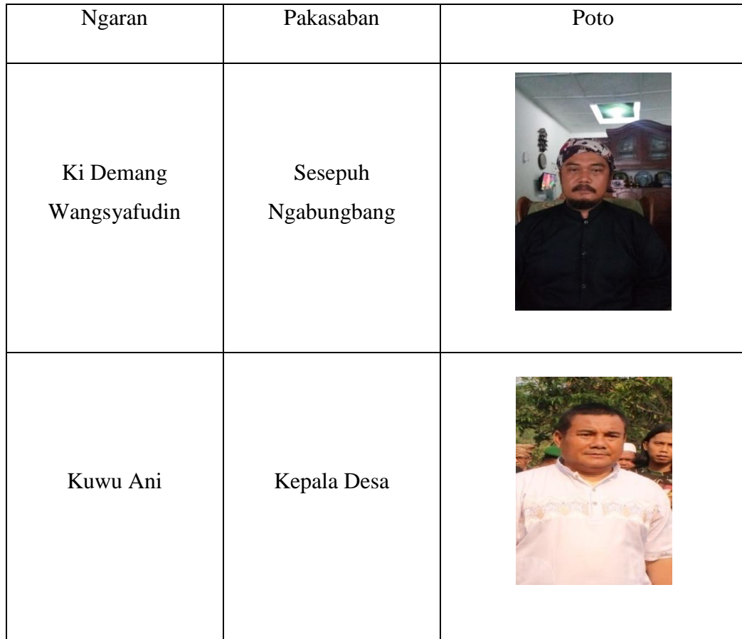
Data Informan Upacara Adat Ngabungbang di Batu Lawang