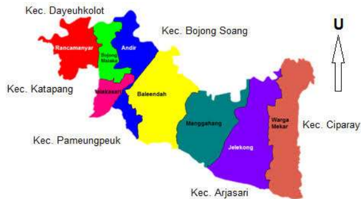
Gambar 3.2 Péta Kecamatan Baleendah