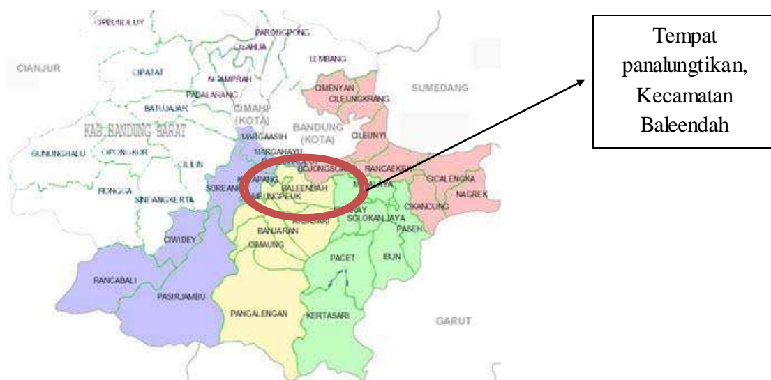
Gambar 3.1 Péta Kabupaten Bandung

SIMBOL JEUNG MA'NA DINA RUNTUYAN UPACARA ADAT NGARAS DI KECAMATAN BALEENDAH KABUPATEN BANDUNG