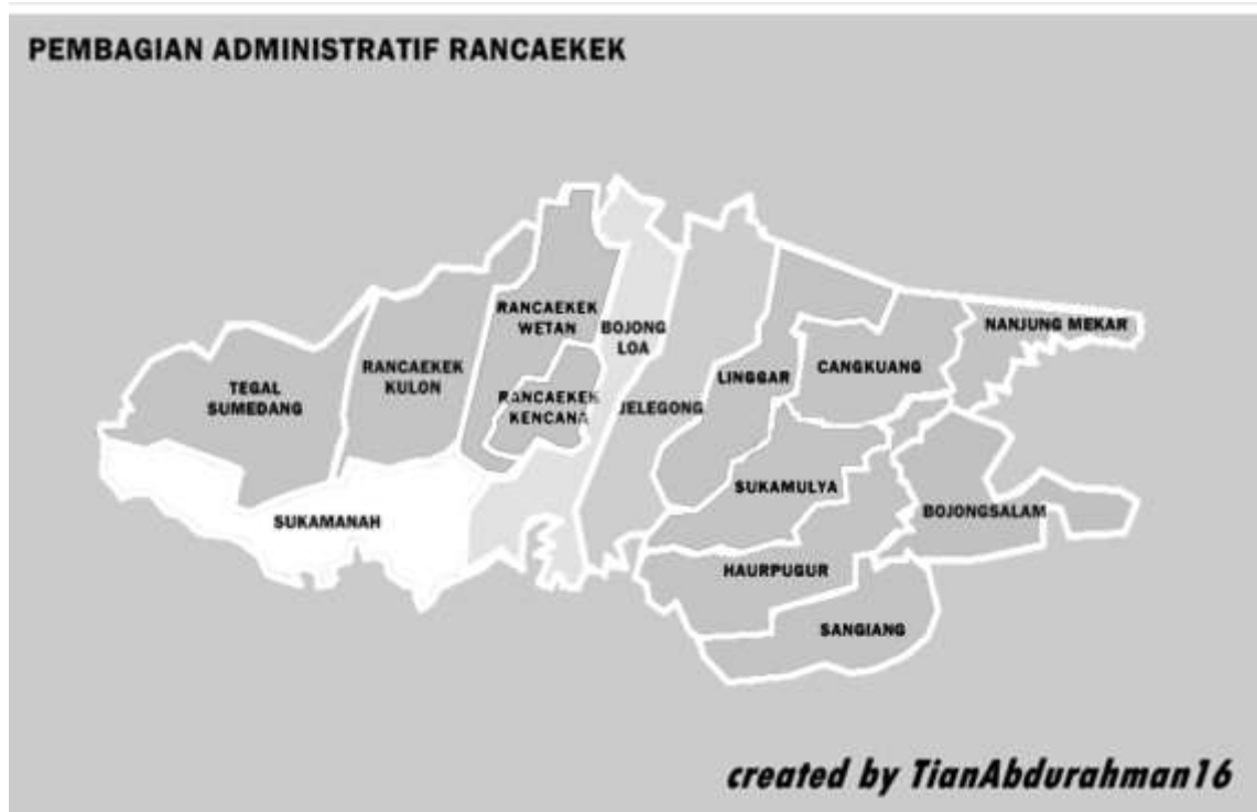
Gambar 3.2 Peta Kecamatan Rancaekek

Alesan Kacamatan Rancaekek Kabupatén Bandung dijadikeun tempat panalungtikan nya éta: