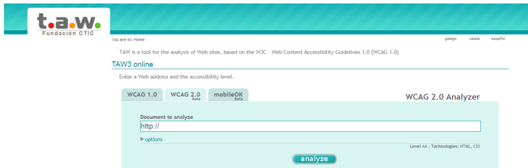
Gambar 3.2 Tampilan Depan Web TAW