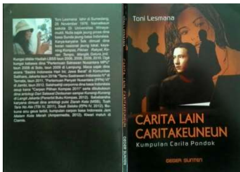
Gambar 3.2 Cover Kumpulan Carpon Carita Lain Caritakeuneun