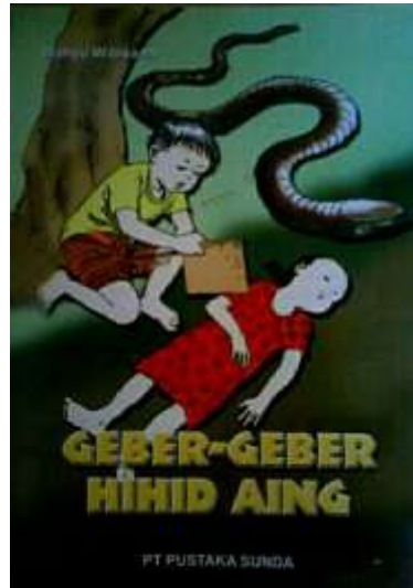
Gambar 3.1 Jilid Naskah Drama Geber-geber Hihid Aing