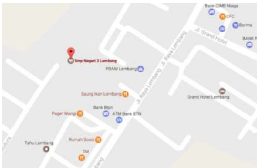
Gambar 3.1 Peta lokasi penelitian

Penelitian ini dilakukan di SMPN 3 Lembang yang beralamatkan di Jl. Raya Lembang No. 29, Kab Bandung Barat, Lembang.