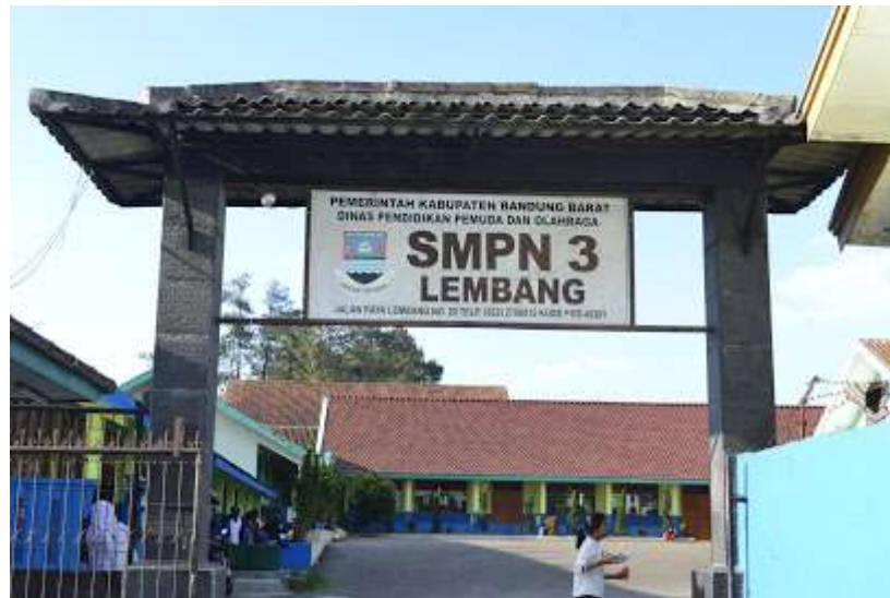
Gambar 3. 2 SMPN 3 Lembang

Lokasi ini dipilih karena SMP 3 Lembang merupakan sekolah yang memiliki kegiatan ekstrakurikuler drum band yang pernah mendapatkan gelar juara tingkat kecamatan maupun kabupaten. Sehingga menghasilkan siswa-siswi yang berprestasi dalam bidang musik khususnya drum band . Dengan terlihatnya hasil yang membanggakan ini perlu adanya metode-metode yang diberikan dalam pelatihan kegiatan ekstrakurikuler drum band ini salah satunya metode tutor sebaya. Metode ini tentunya sudah diterapkan pada saat proses latihan. Menurut para ahli, metode ini sangat baik untuk siswa, akan tetapi pada kenyataannya siswa berpengaruh sebaliknya. Hal inilah yang membuat keterkaitan peneliti dalam melakukan penelitian.