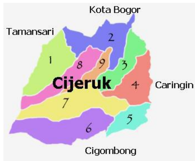
Peta Lokasi Kacamatan Cijeruk

Ieu lokasi téh dijadikeun tempat panalungtikan. Pangna ieu daérah dijadikeun tempat panalungtikan lantaran di Kecamatan Cijeruk téh miboga masarakat nu beragam dina ngagunakeun basa sapopoéna.