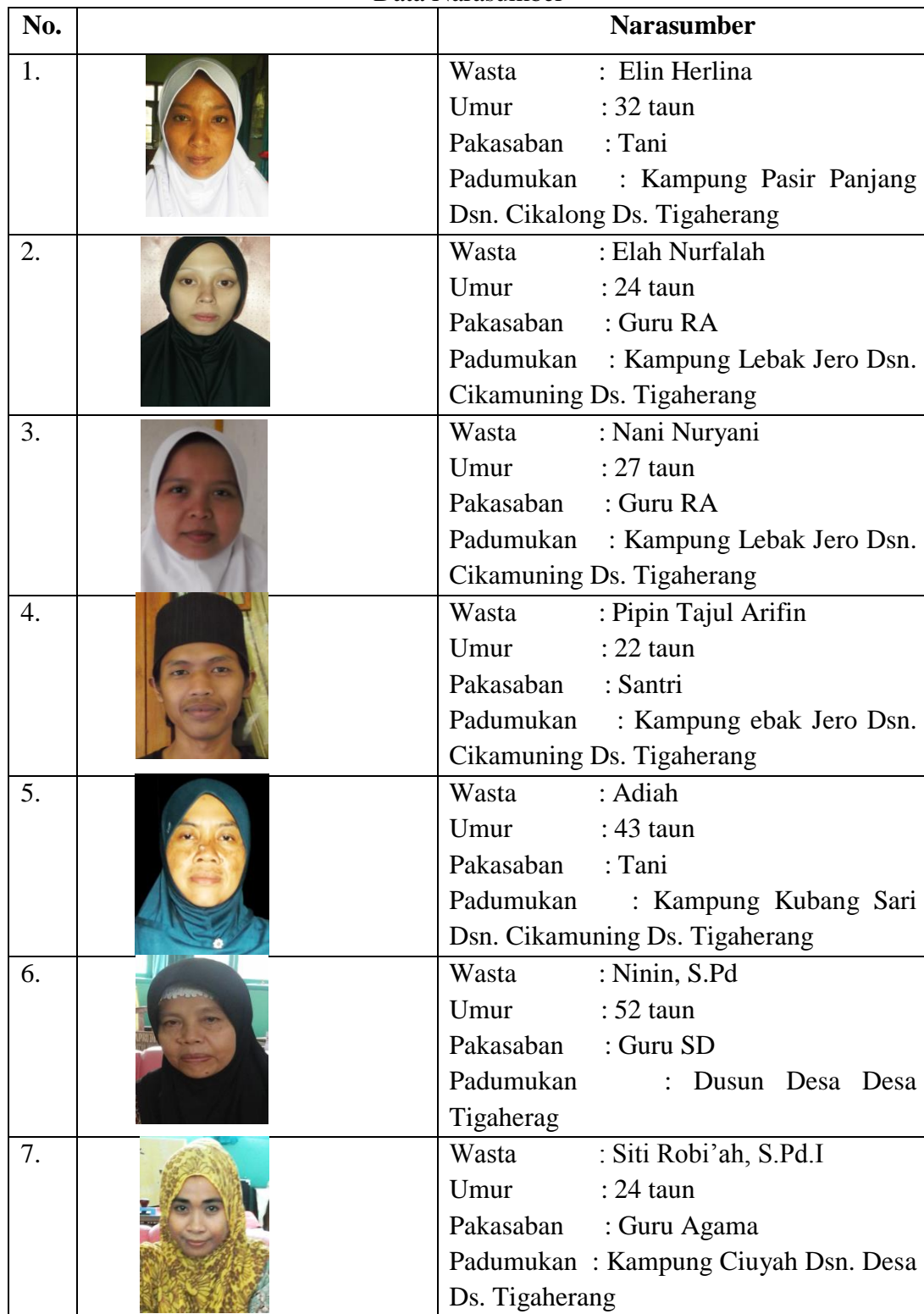
Tabel 3.4 Data Narasumber