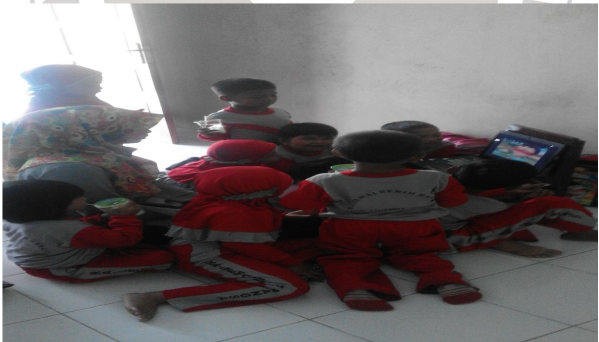
Foto peneliti melakukan pengumpulan data