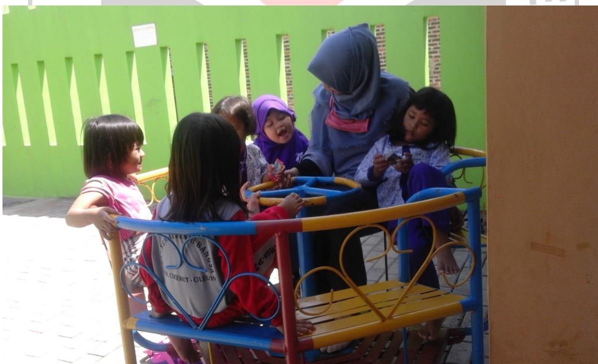
Foto peneliti melakukan pengumpulan data