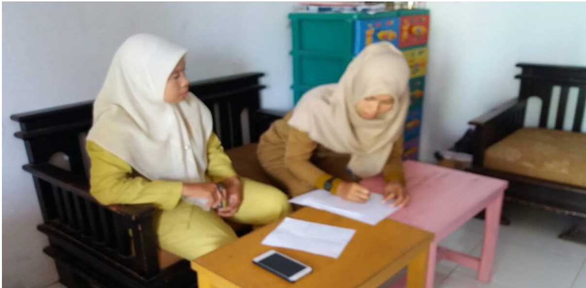
Foto wawancara dengan Kepala Sekolah RA. SBB