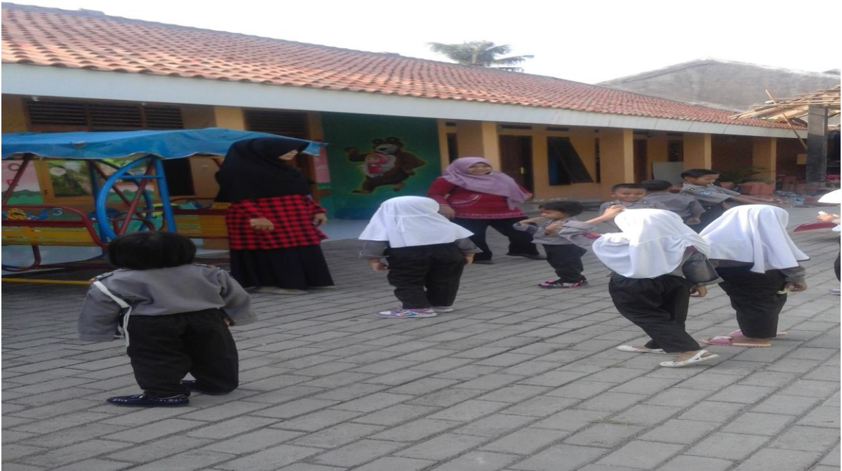
Foto peneliti melakukan pengumpulan data