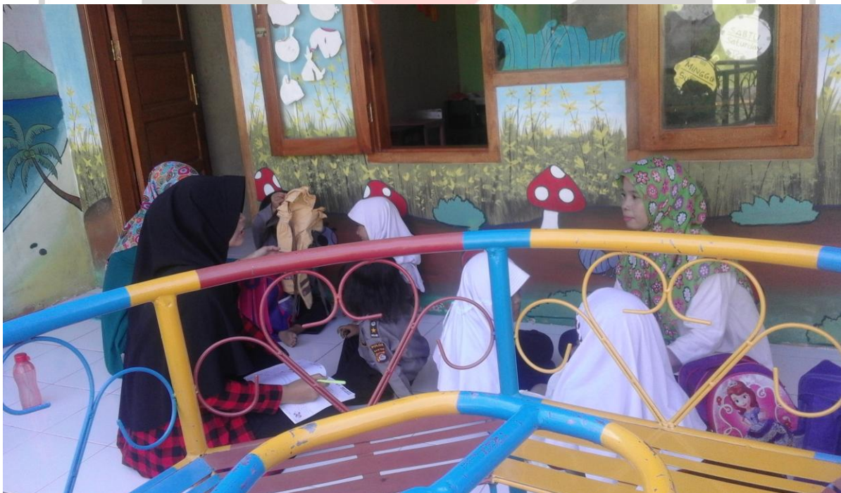
Foto wawancara dengan Guru dan Kepala Sekolah RA. SBB