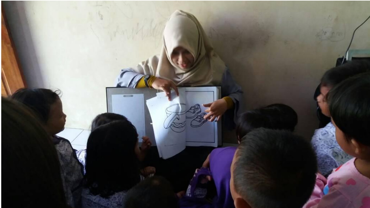
Foto peneliti melakukan pengumpulan data