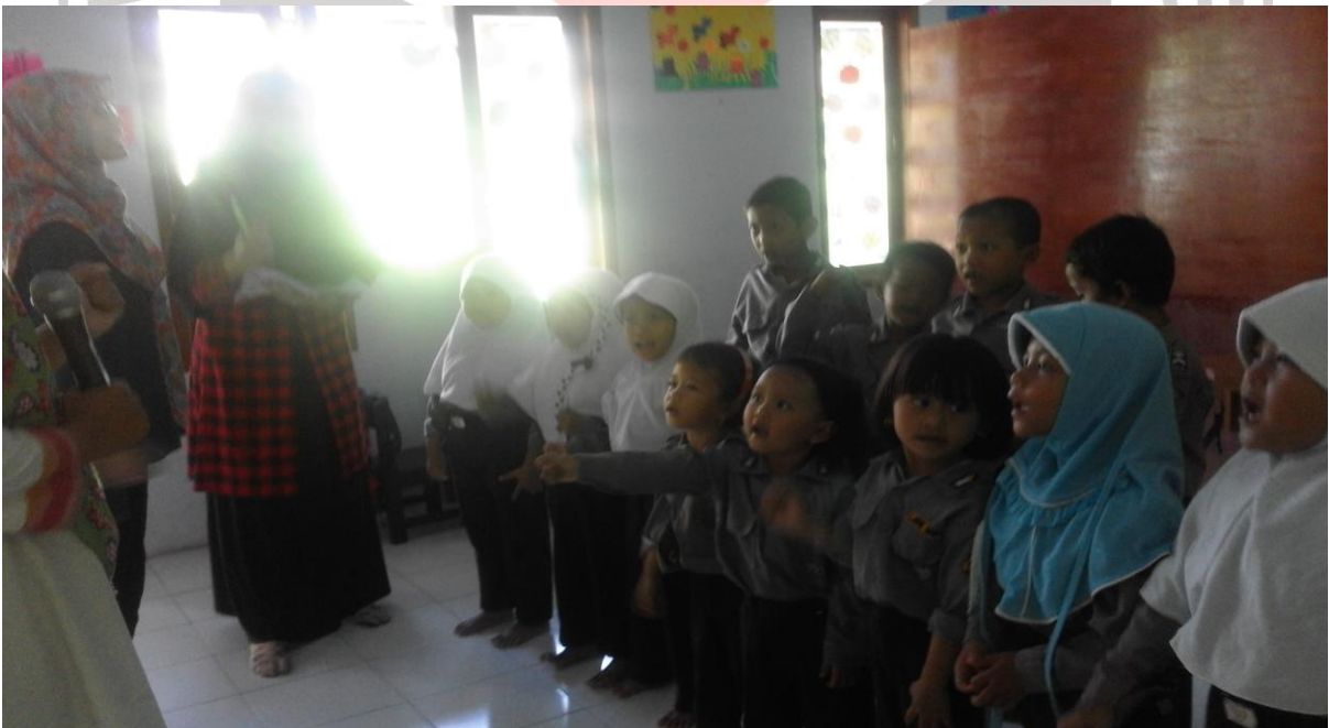
Foto peneliti melakukan pengumpulan data