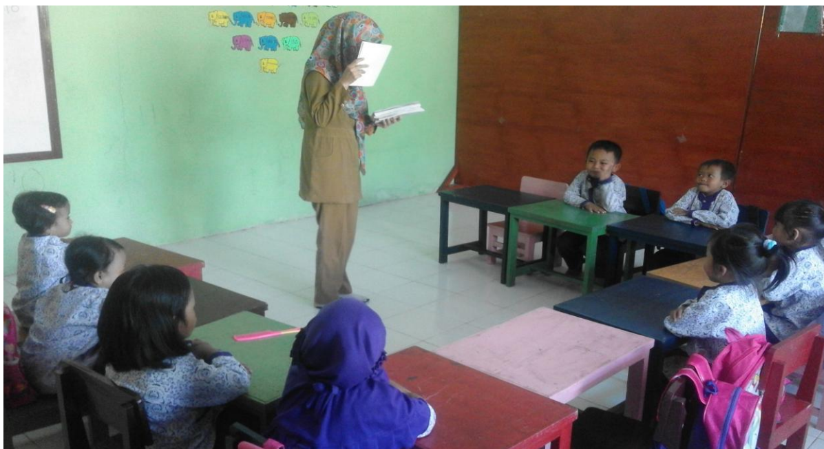
Foto peneliti melakukan pengumpulan data