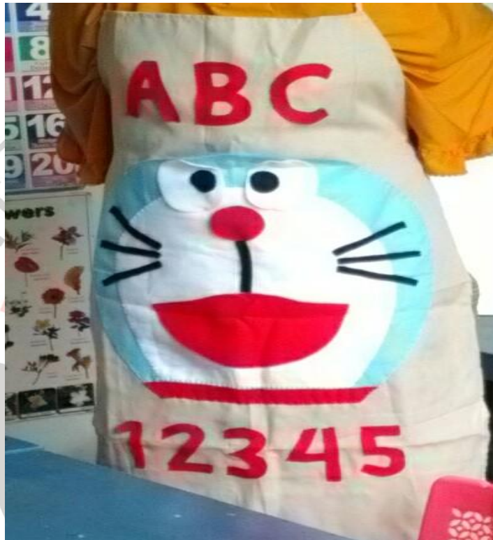
Foto Media Pembelajaran dan APE Kantong Pintar