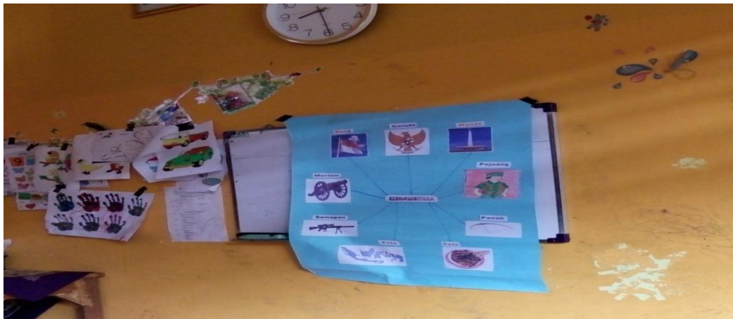
Gambar Mind Mapping Di Siklus III Lembar Kerja Anak dan Anak Yang Sedang Mengerjakan Tugas