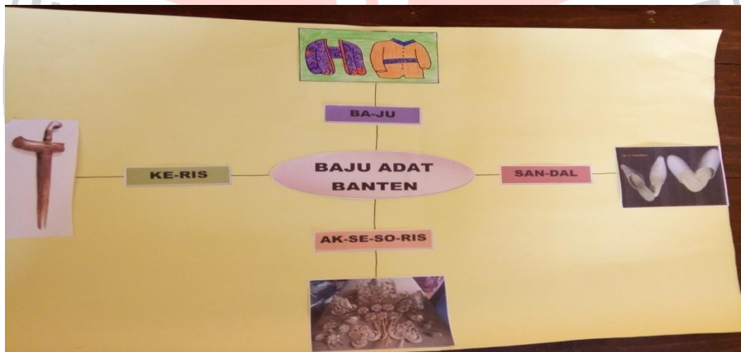
Gambar Mind Mapping Di Siklus II