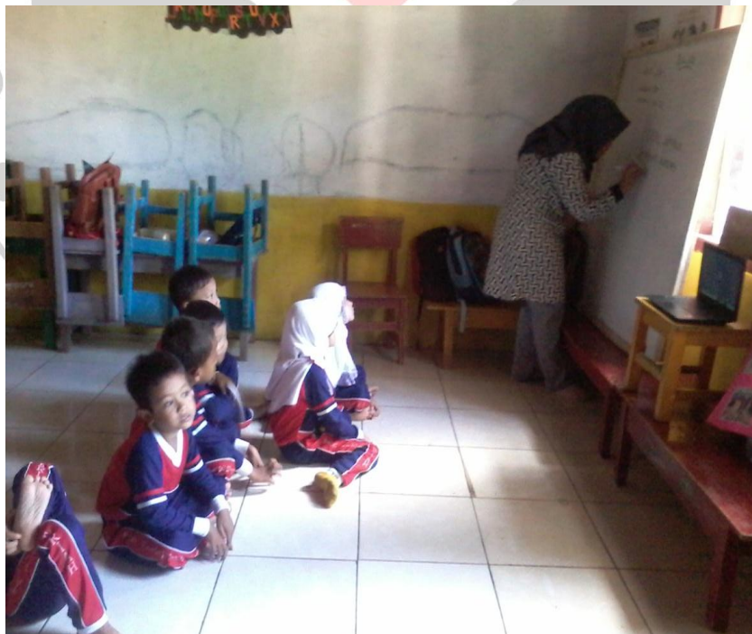
Riati, 2017 PERMAINAN TRADISIONAL PREPET JENGKOL TERHADAP PERKEMBANGAN MOTORIK KASAR ANAK KELAS B2 TK AL-KHAERIAH Universitas Pendidikan Indonesia | repository.upi.edu | perpustakaan.upi.edu