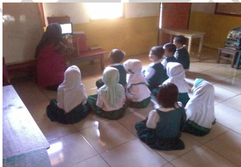
Riati, 2017 PERMAINAN TRADISIONAL PREPET JENGKOL TERHADAP PERKEMBANGAN MOTORIK KASAR ANAK KELAS B2 TK AL-KHAERIAH Universitas Pendidikan Indonesia | repository.upi.edu | perpustakaan.upi.edu