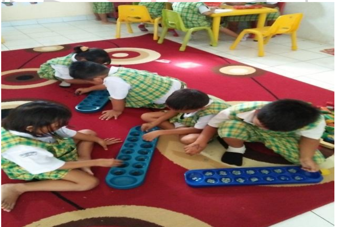
Fitri, 2017 ANALISIS POLA PEMAHAMAN ANAK TERHADAP PEMBUATAN MEDIA PEMBELAJARAN KEMAMPUAN KOGNITIF ANAK 5-6 TAHUN Universitas Pendidikan Indonesia | repository.upi.edu | perpustakaan.upi.edu