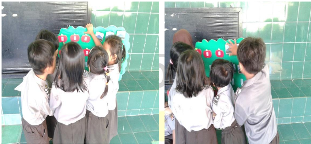
Kegiatan Anak Saat Kuis Individu