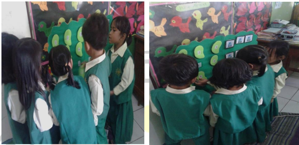
Lampiran 7. Foto Kegiatan Penelitian