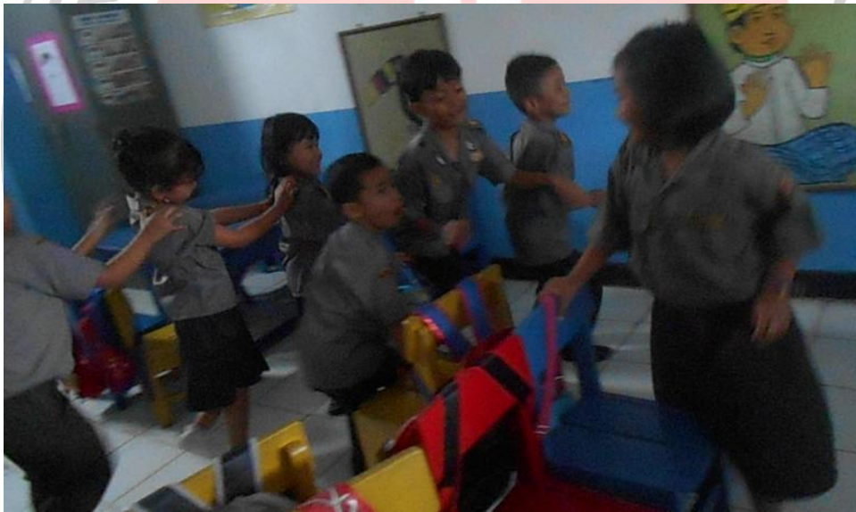
Anakkembali mengelilingi kursi