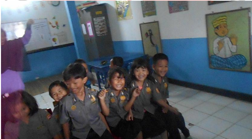
Guru menghentikan musik