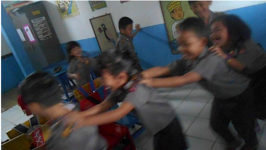
Anak memunculkan ekspresi emosi positif ketika mengelilingi kursi