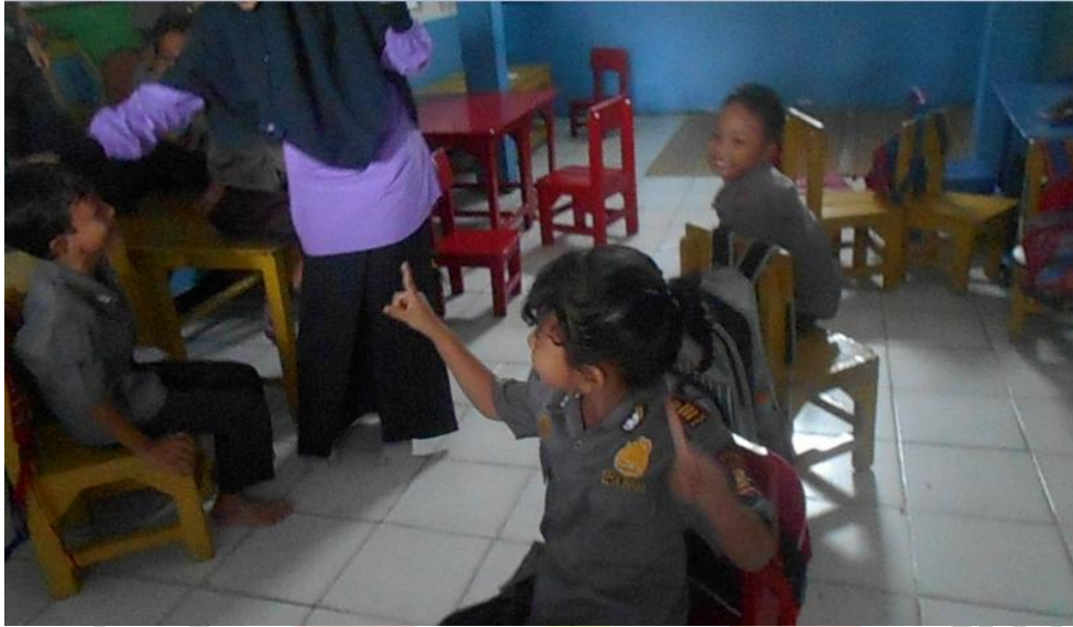
Ad menjadi “RatuSenggol”