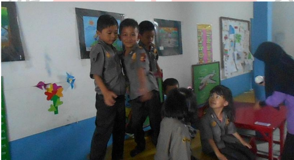
Anak yang sudah tereliminasi menyemangati ketigatemanannya “supporter”