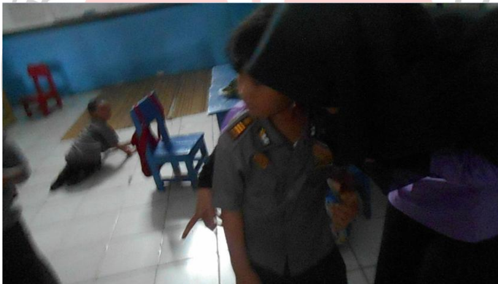
Guru menjelaskan kembali kepada Ad tentang cara dan aturan main