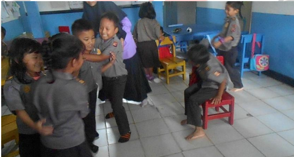
Ky, Fa, Cidan Ad menunjukkan ekspresi emosi yang sayang dengan sesama teman ketika tau akan bermain lagi permainan senggol musik