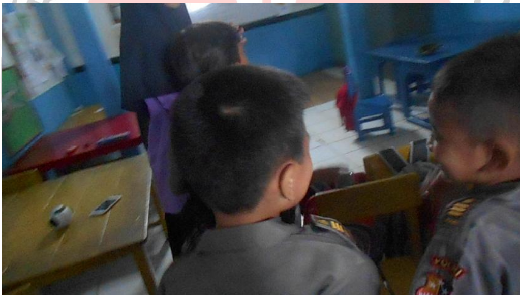
Fadan Ad menjalinkomunikasi