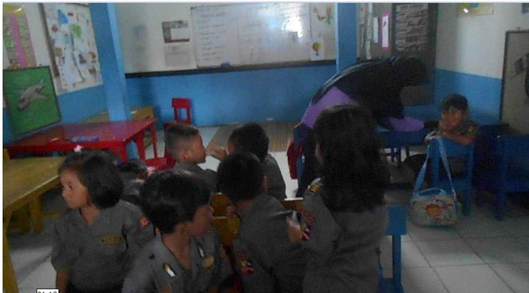
Guru membujuk Ad