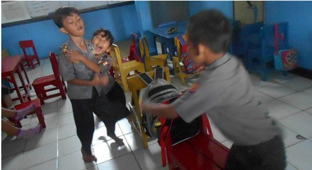
Ad menunjukkan ekspresi emosi kasih sayang kepada Zy