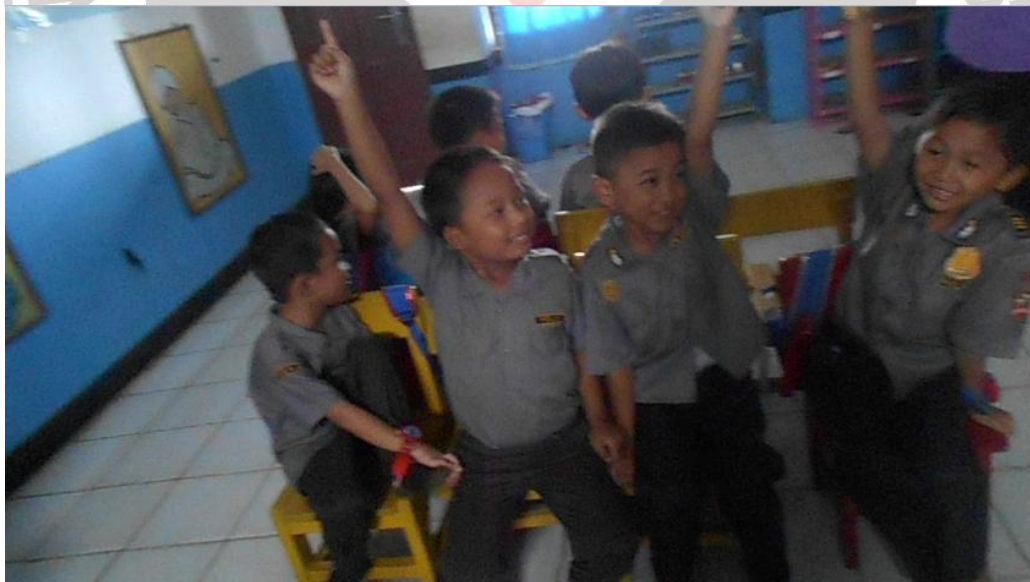
Kegiatan Tanya jawab antara guru dengan anak