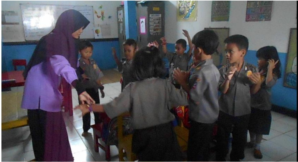
Permainan ronde pertama akan segera dimulai