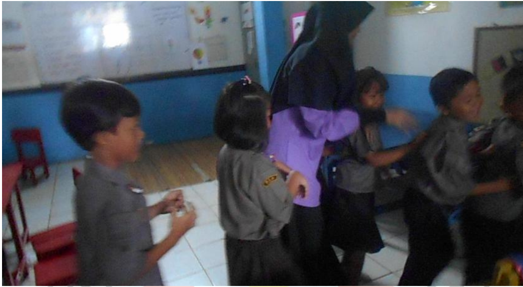
Permainan Senggol Musik ronde pertama dimulai