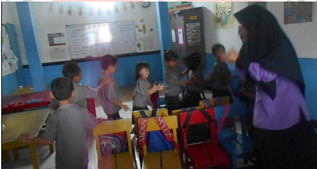
Anak bersemangat mengelilingi kursi