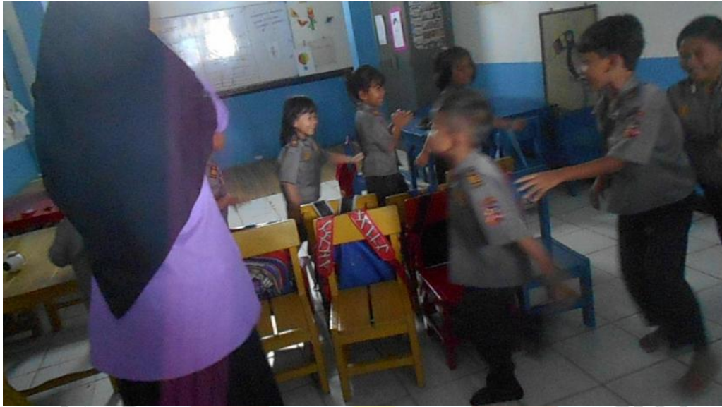
Anakkembali mengelilingi kursi