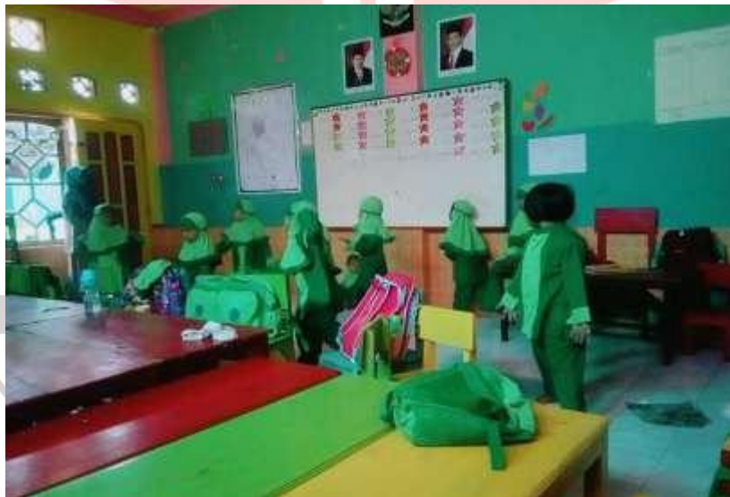
Gambar Anak Sedang Bernyanyi Bahasa Inggris Dan Bergerak