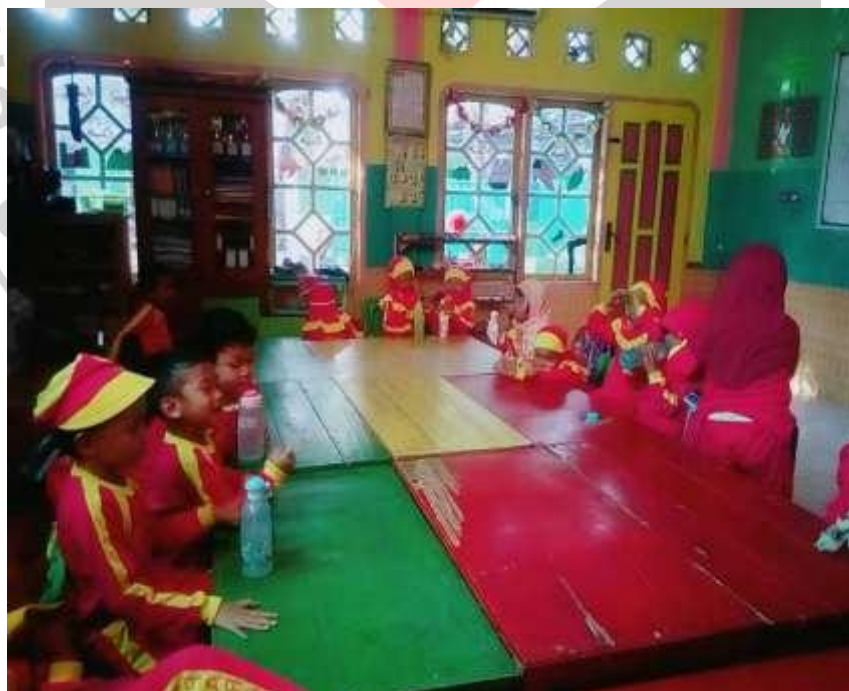
Gambar Kegiatan Evaluasi.