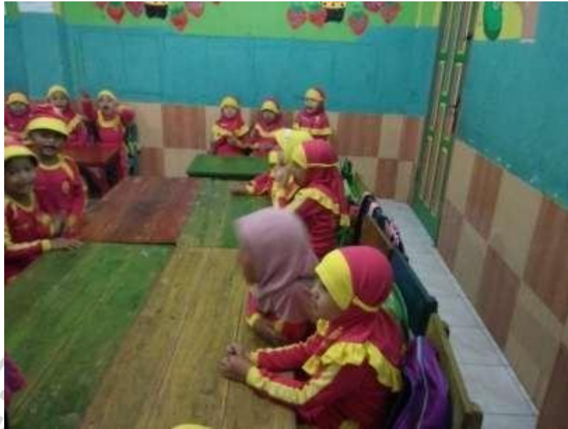
Gambar Kegiatan Pembiasaan Listen And Repeat