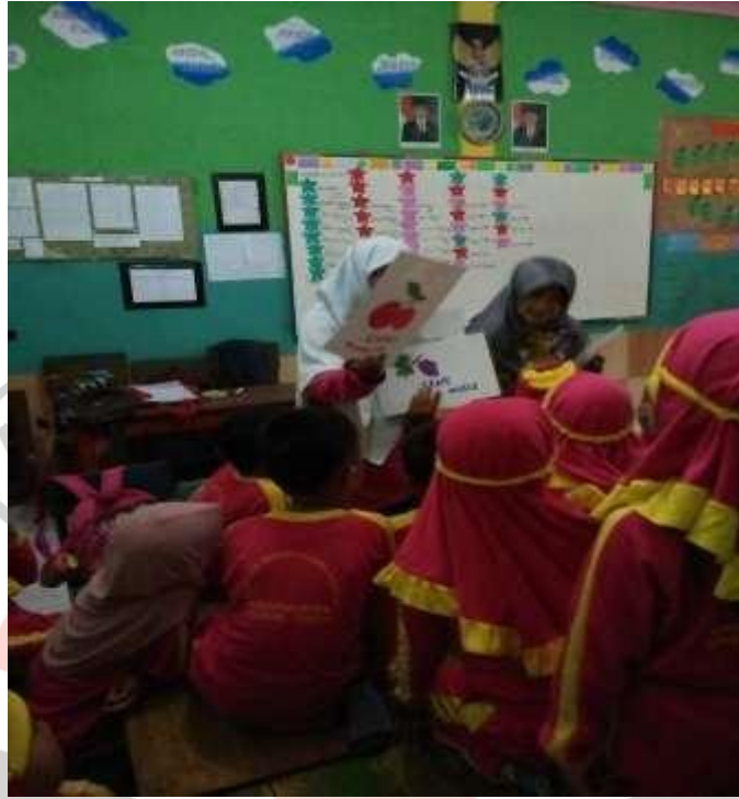
Gambar Anak Sedang Diperkenalkan Buah-Buahan Dalam Bahasa Inggris