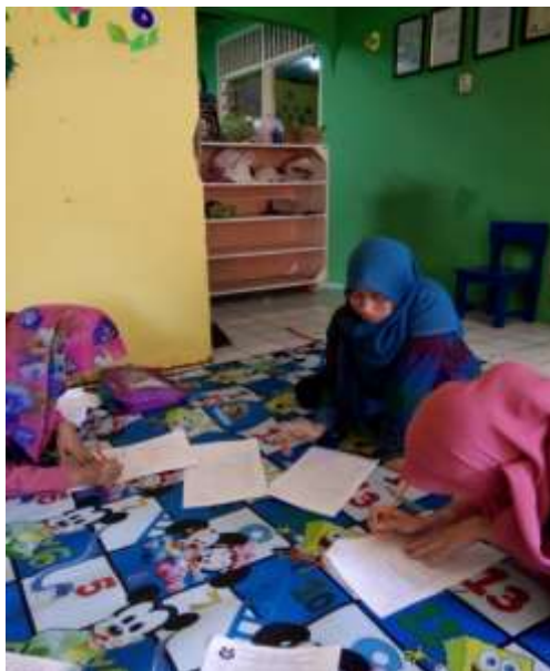
Gambar 3 Responden PAUD TPA Kartika Doa Bangsa, Karang Tengah