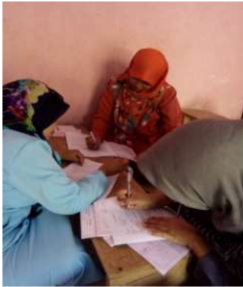
Gambar 1 Responden PAUD KOBER Al Hidayah, Cimanggu