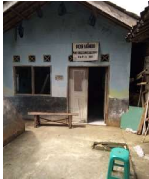
Gambar 14 Gedung PAUD SPS Ageung Jaya, Pamuruyan