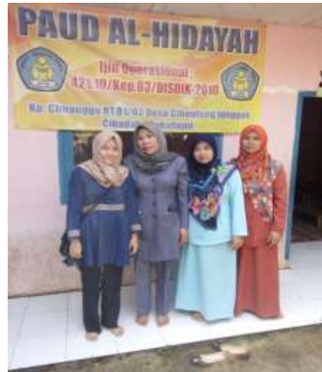
Gambar 8 Foto Bersama Responden