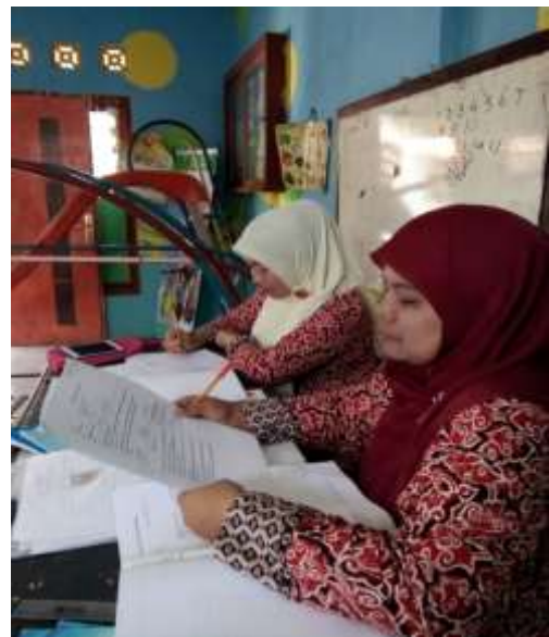
Gambar 2 Responden PAUD SPS TP Cempaka, Pabuaran