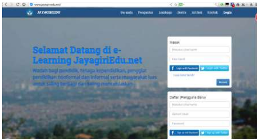
Gambar 15. Halaman Login Website Jayagriedu.net sebagai sarana e-training