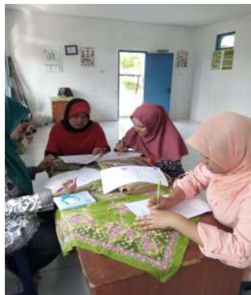
Gambar 4 Responden PAUD SPS TP Anyelir 018, Sekarwangi