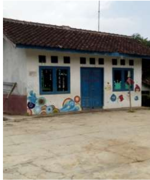
Gambar 12 Gedung PAUD SPS Bougenvil, Karang Tengah