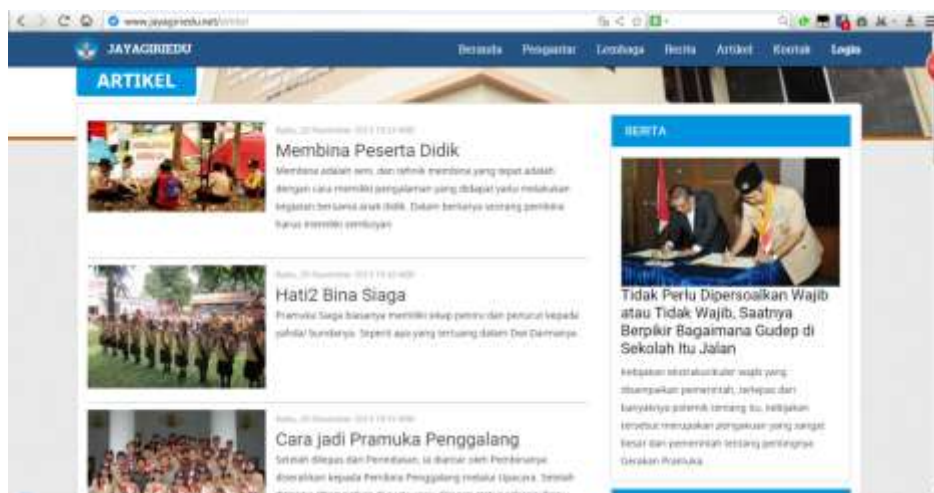
Gambar 16. Halaman Artikel Website Jayagriedu.net sebagai sarana e-training