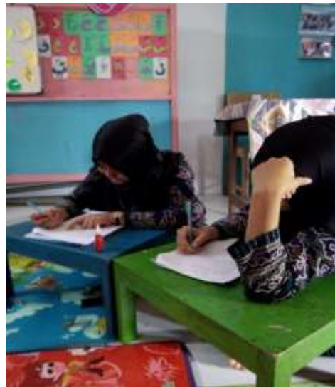
Gambar 6 Responden PAUD SPS TP Melati, Sekarwangi