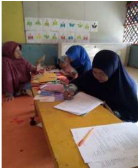
Gambar 5 Responden PAUD SPS Aster, Ciandam