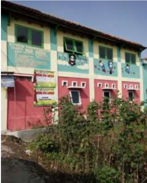
Gambar 11 Gedung PAUD KOBER Nuraisyah, Sekarwangi