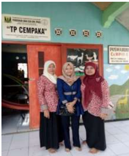
Gambar 7 Foto Bersama Responden