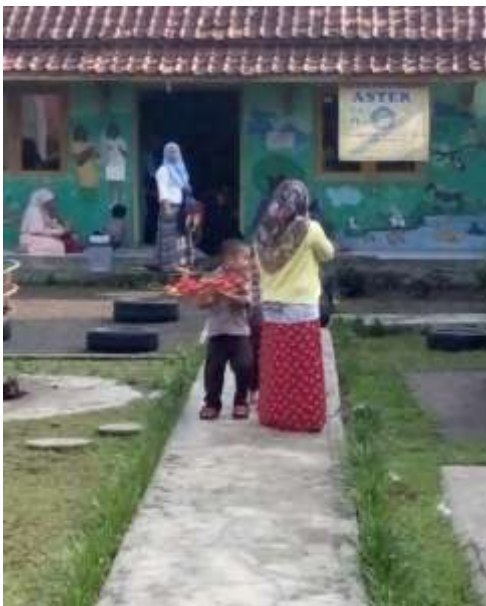
Gambar 13 Gedung PAUD SPS Aster, Karang Tengah