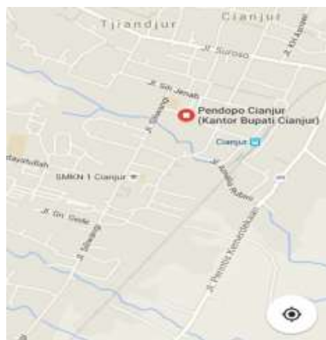
Gambar 3.1 Peta Kecamatan Cianjur