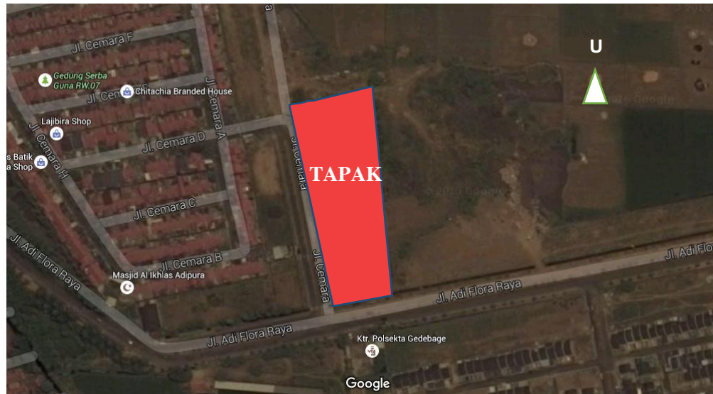
Gambar 3.3 Lokasi Proyek (Diadaptasi dari Google Maps)

sebagai aksis utama dalam perumahan, sehingga kemudahan akses kendaraan terpenuhi. Karena peruntukan sebagai fasilitas umum dari perumahan hendaknya jangkauan dan cakupan berada di tengah perumahan, namun memungkinkan juga untuk siswa dari luar kompleks perumahan.