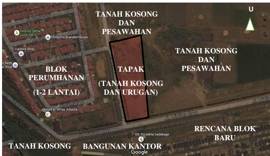
Gambar 3.4 Rona Lingkungan Proyek (Diadaptasi dari Google Maps)

Kondisi lingkungan pada saat iniyaitu kondisi atau komponen-komponen lingkungan awal sebelum perencanaan dan pembangunan fisik dimulai dapat dideskripsikan sebagai berikut: