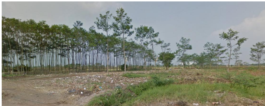
Gambar 3.5. View lokasi ke Utara (Dokumen penulis)