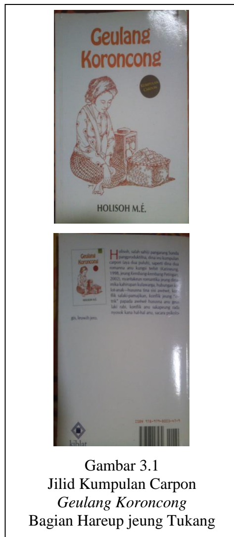
Gambar 3.1 Jilid Kumpulan Carpon Geulang Koroncong Bagian Hareup jeung Tukang

Warna dasar jilid bodas. Di sisi belah katuhu aya tulisan “Kiblat belajar sepanjang hayat”, handapeunana aya tulisan Geulang Koroncong minangka judul