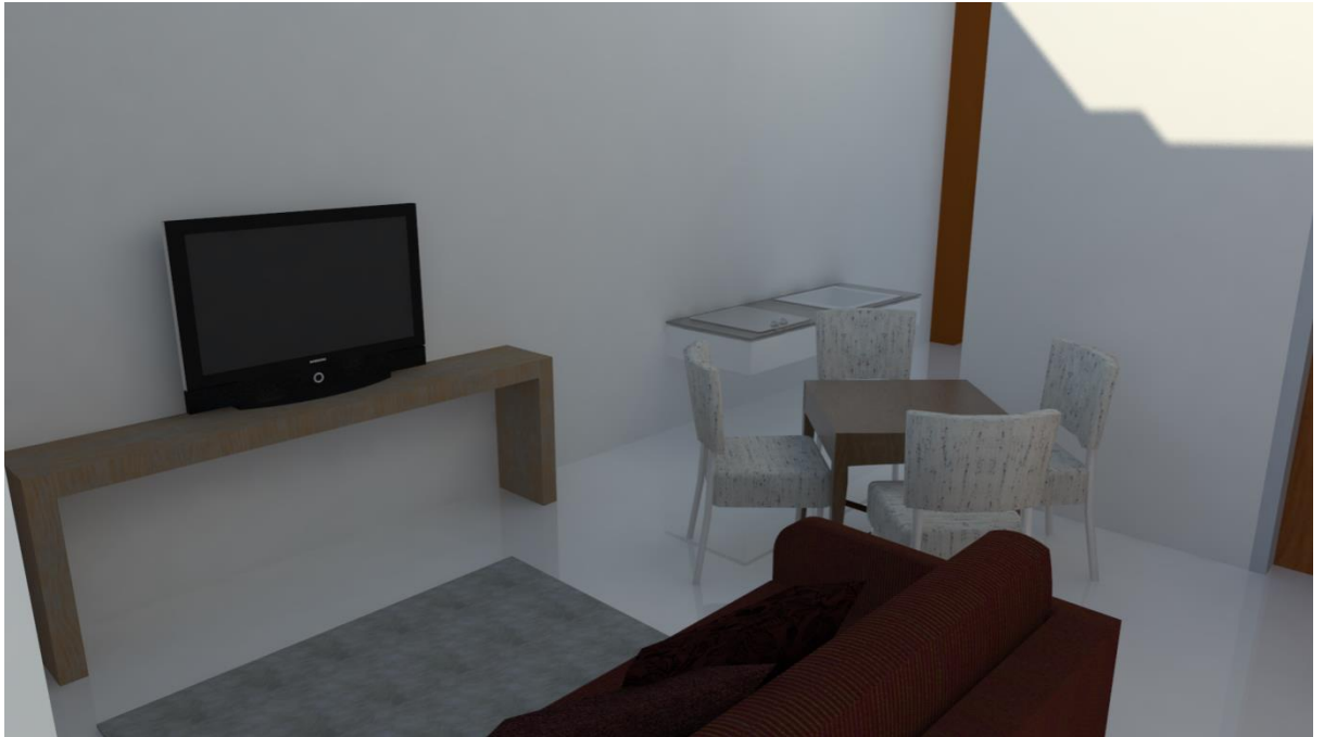
Gambar3.19: 3D interior Tipe 2 Bedroom & 3 Bedroom