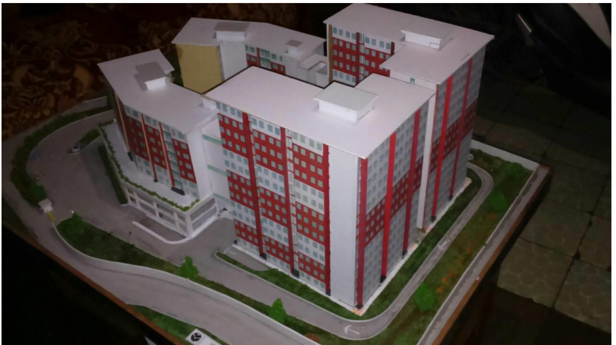
Gambar3.4: Maket Grand Sulanjana Apartment