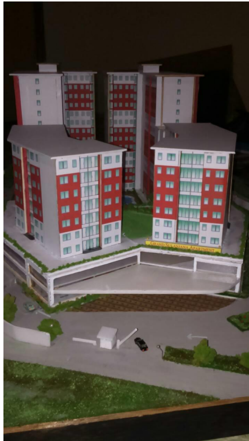
Gambar3.1: Maket Grand Sulanjana Apartment