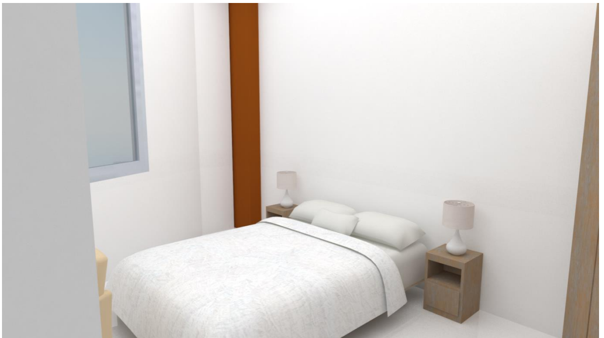
Gambar3.14: 3D interior Tipe 2 Bedroom & 3 Bedroom