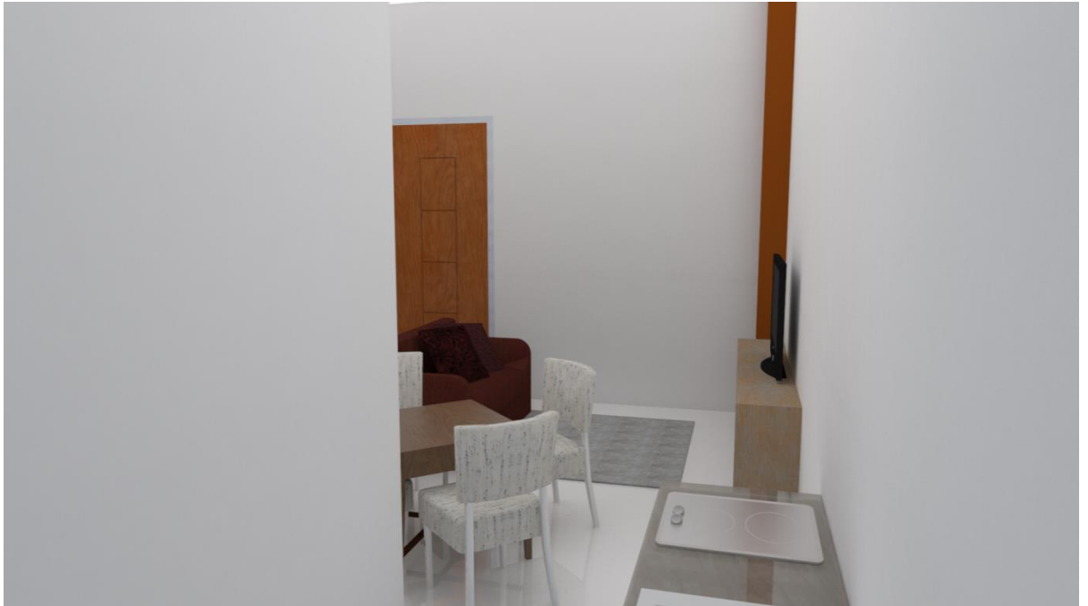
Gambar3.15 3D interior Tipe 2 Bedroom & 3 Bedroom