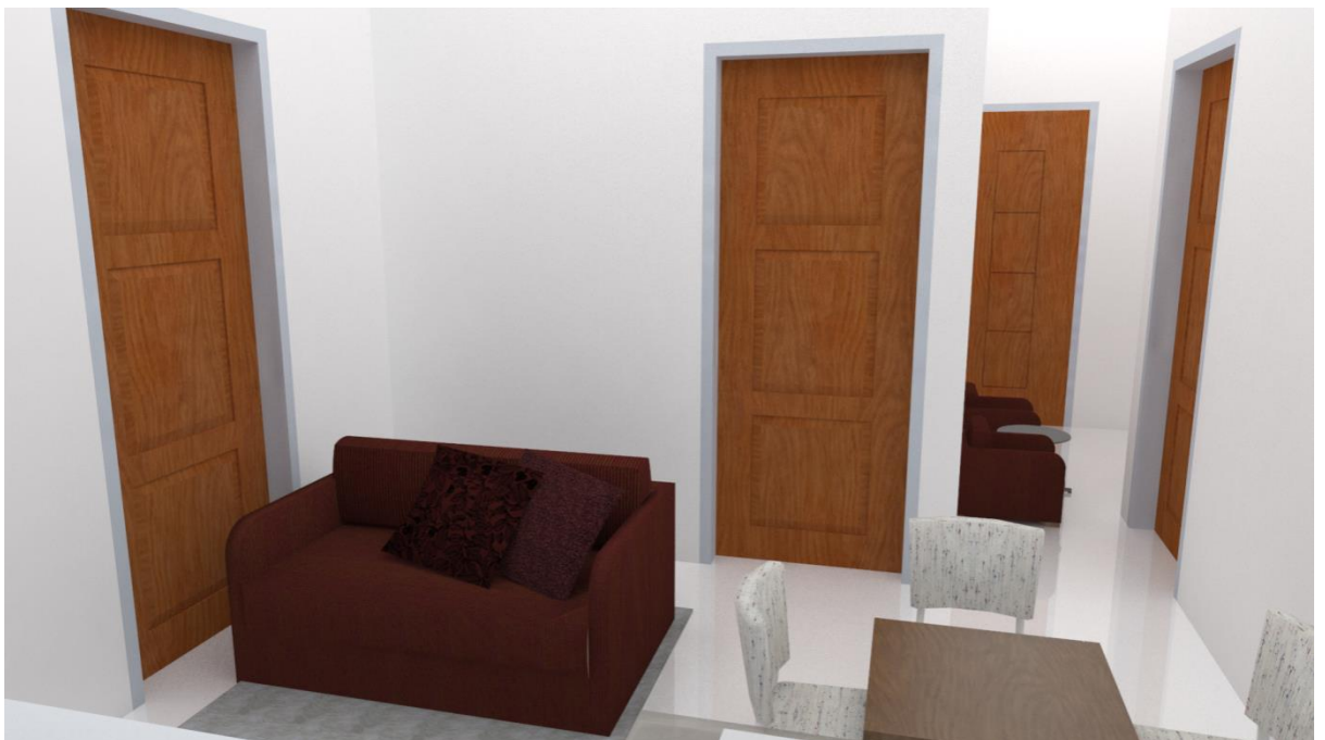
Gambar3.16: 3D interior Tipe 2 Bedroom & 3 Bedroom