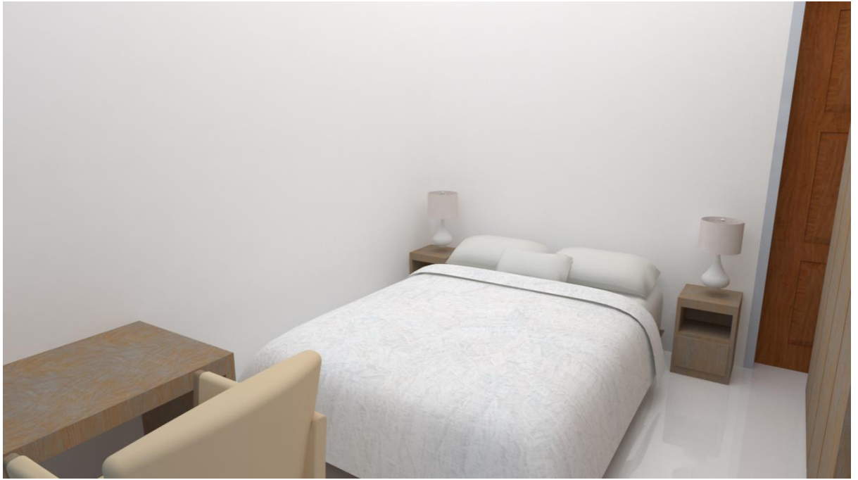
Gambar3.13: 3D interior Tipe 2 Bedroom & 3 Bedroom