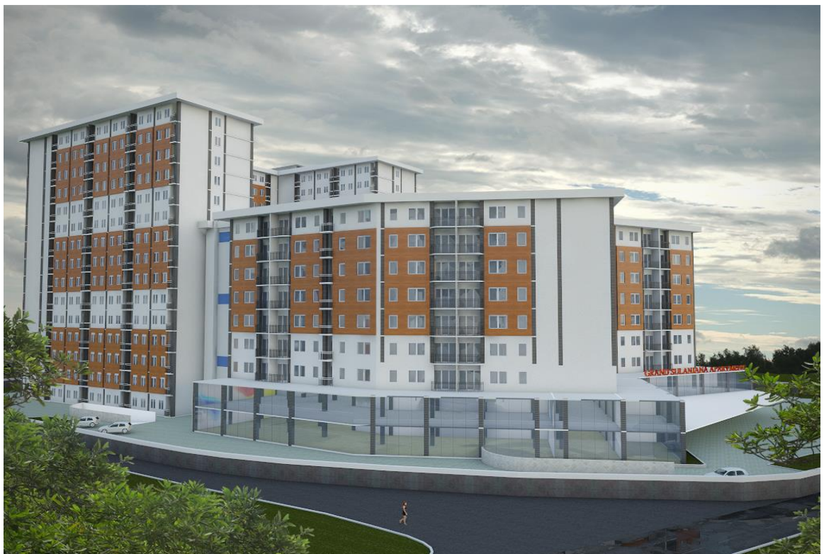
Gambar3.8: 3D eksterior Grand Sulanjana Apartment