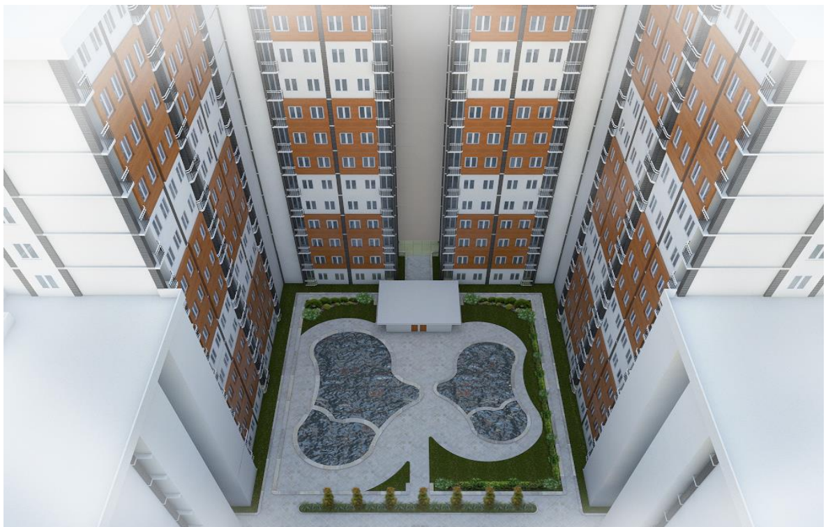
Gambar3.10: 3D eksterior Grand Sulanjana Apartment