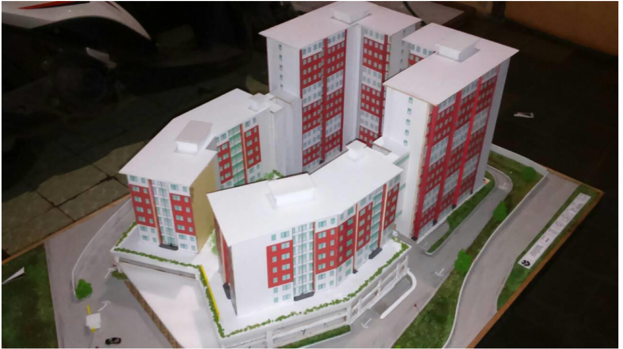
Gambar3.3: Maket Grand Sulanjana Apartment