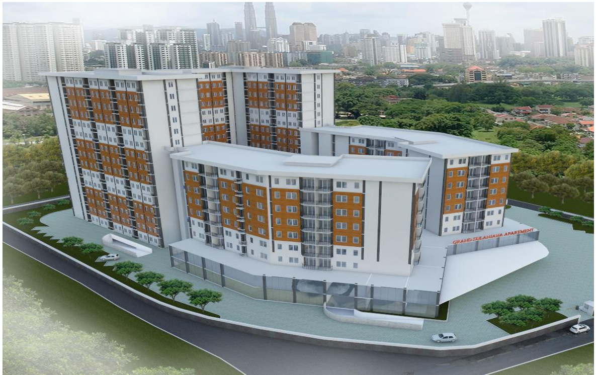
Gambar3.9: 3D eksterior Grand Sulanjana Apartment