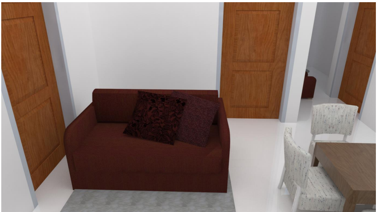
Gambar3.18: 3D interior Tipe 2 Bedroom & 3 Bedroom