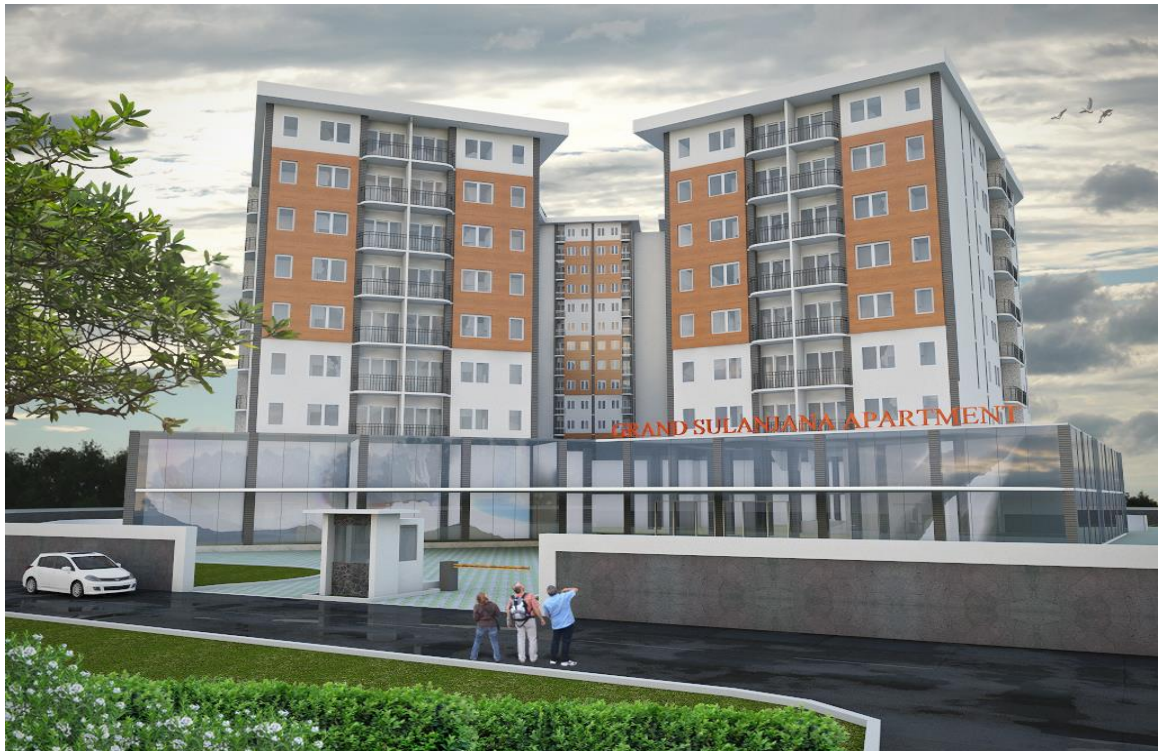
Gambar3.7: 3D eksterior Grand Sulanjana Apartment