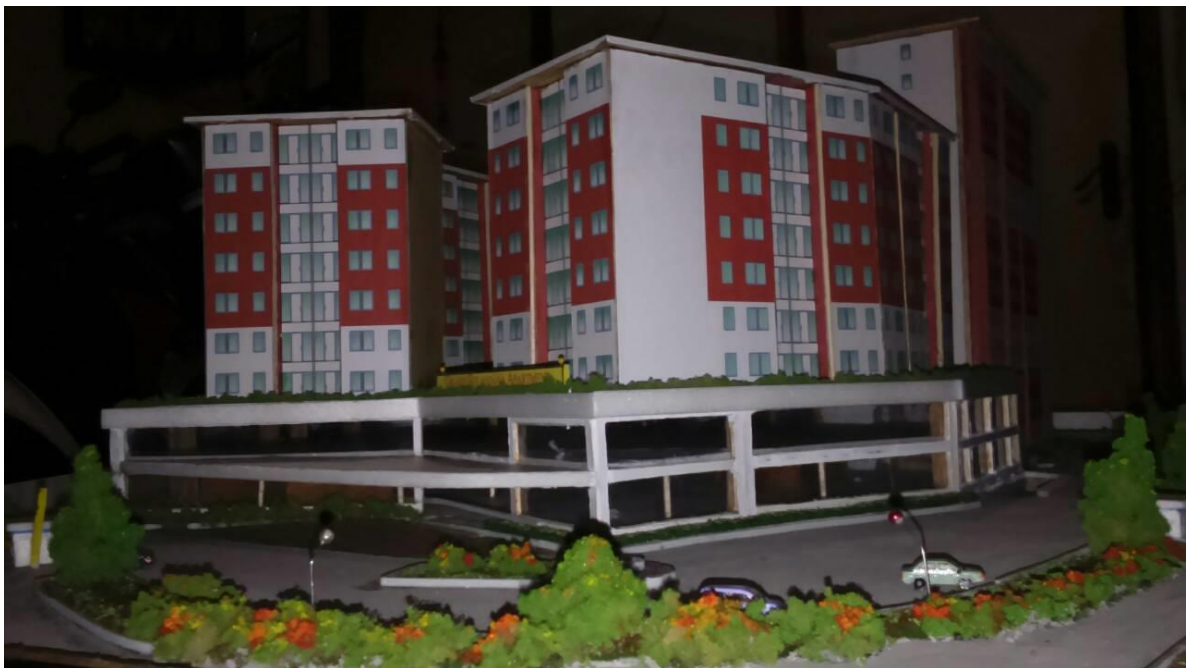
Gambar3.2: Maket Grand Sulanjana Apartment