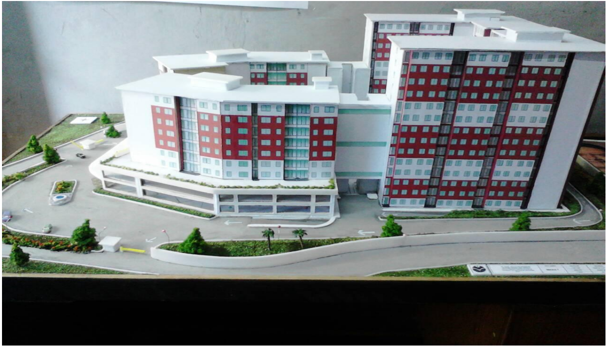
Gambar3.5: Maket Grand Sulanjana AApartment